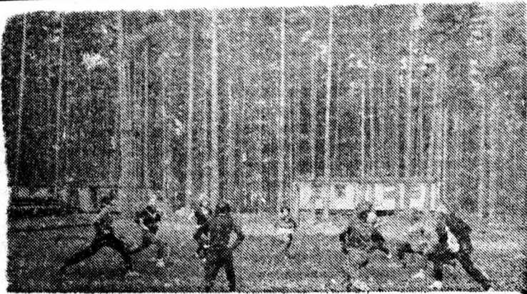
На утренней зарядке.

Казалось бы, что здесь плохого? Ну приехали на природу, ну поселились.