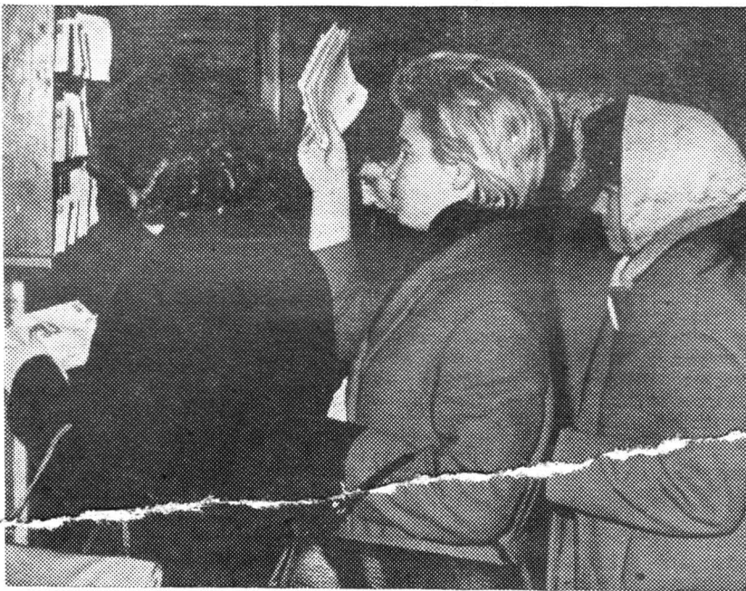
Письма из дома.