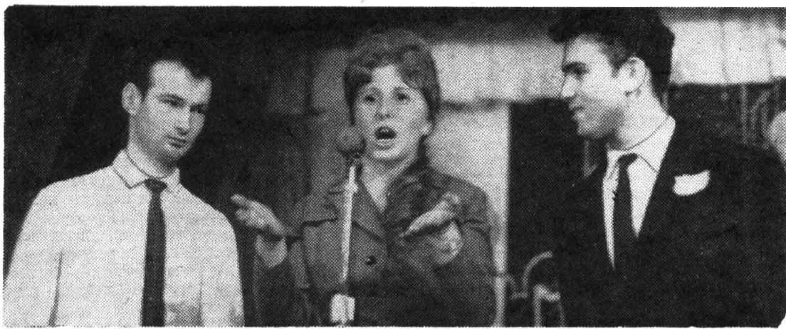
На эстраде — два капитана. От того, кто из них более находчив, зависит и судьба команды (вверху).