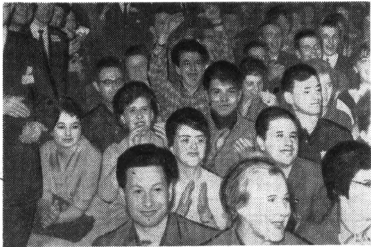
Их усилиями литовцы вышли в финал (внизу).