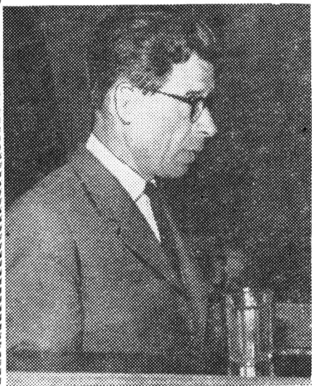
29 мая состоялось отчетно-выборное собрание коммунистов ЛИТМО. Мы даем сокращенный доклад секретаря партбюро т. Мокина и выступления в прениях.

ГОД, прошедший со времени прошлогоднего собрания, отмечен вдохновенным трудом, неутомимой борьбой советского народа за выполнение великой цели, поставленной в Программе партии. Выдвигаемые партией задачи воспринимаются нашим народом, как их родное и кровное дело, ибо вся деятельность партии имеет одну цель — утвердить высшие идеалы человечества: мир, труд, свободу, равенство, братство и счастье всех народов.