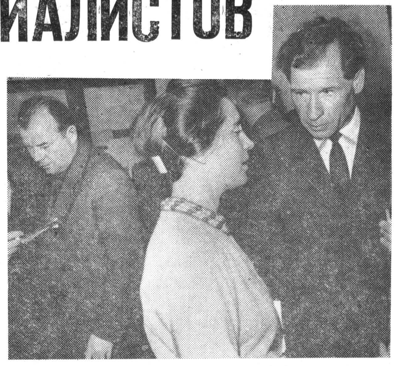
В перерыве собрания...