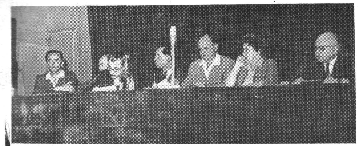
В президиуме отчетно-выборного собрания коммунистов ЛИТМО.