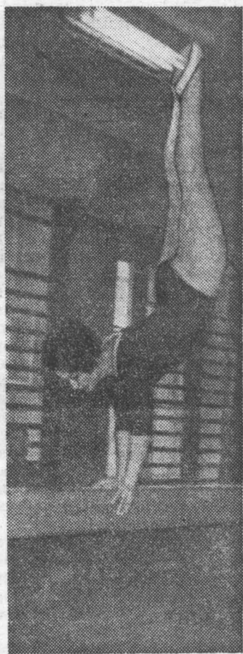
Сборная команда института по спортивной гимнастике приступила к тренировкам. Впереди — сезон ответственных состязаний.

Большой объем работ при высоком качестве выполнен в этом