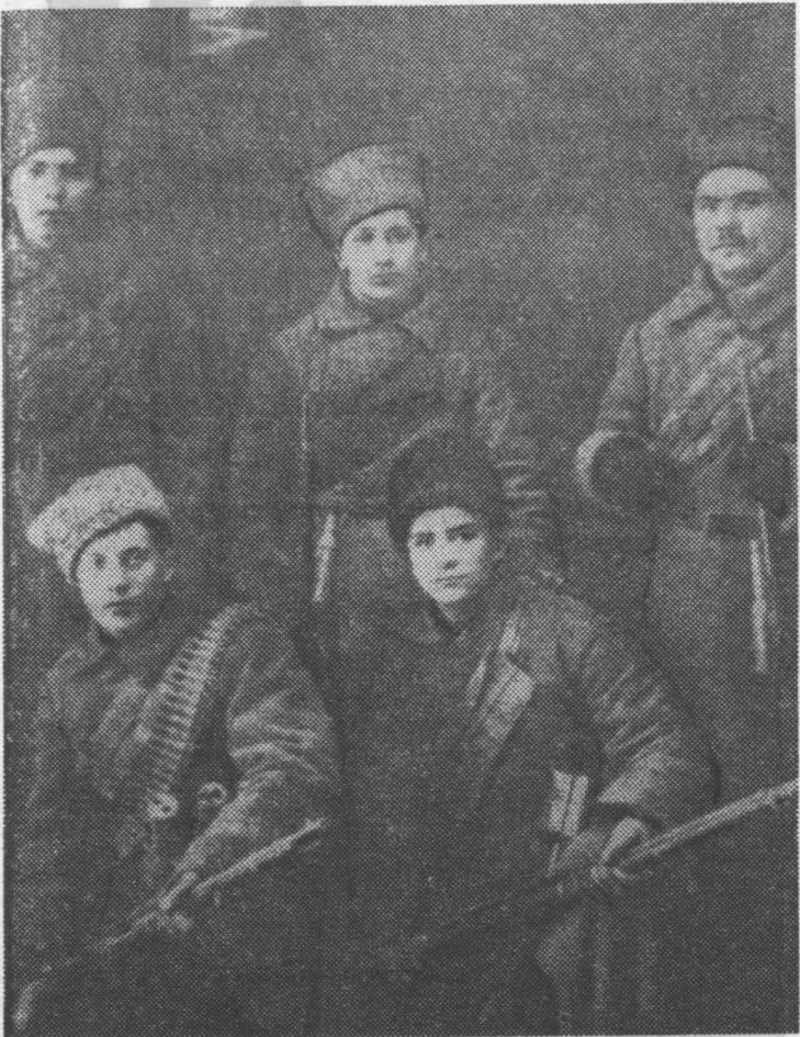
Комсомольцы первого призыва, 1919 год.