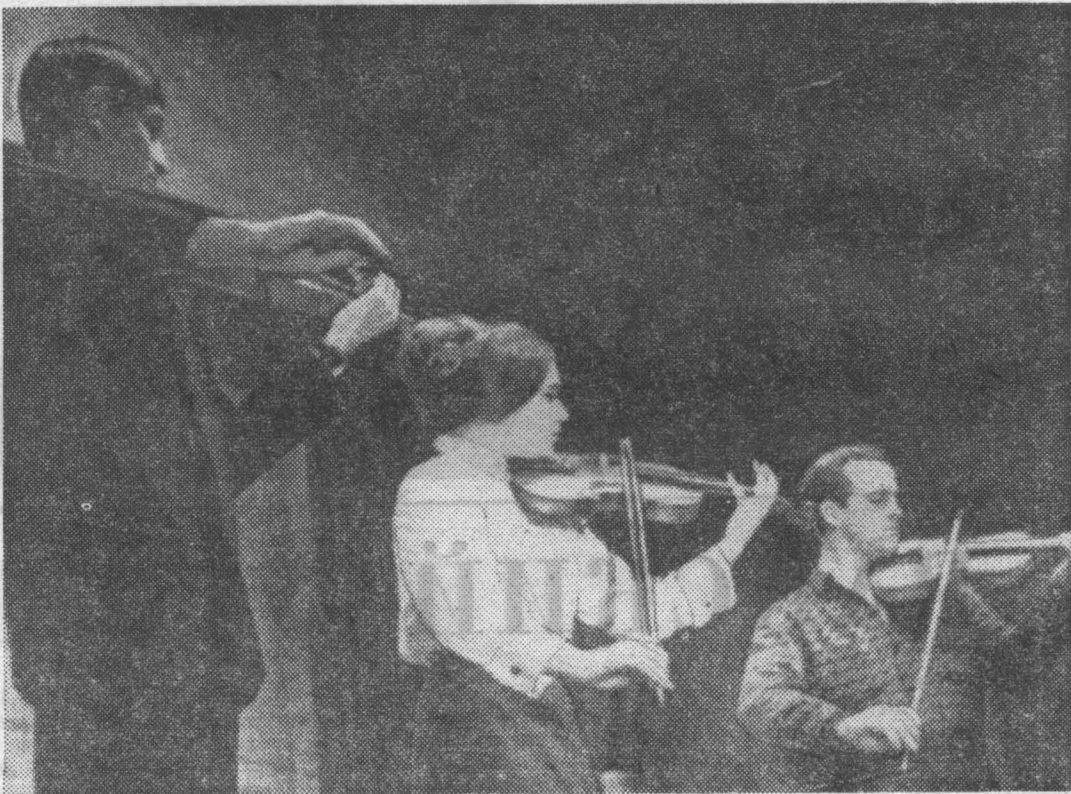
Ансамбль скрипачей на заключительном вечере художественной самодеятельности института. Фотоэтиюд студента 365-й группы Федора Кубочкина

Студенческий профком предпринимает усилия по организации в институте второго эстрадного оркестра. Первый шаг сделан — приобретена новая ударная установка.