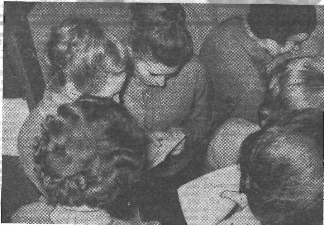
У девочек из 534-й группы серьезный, деловой вид. Им предстоит экзамен по теории оптических приборов. А это — испытание не из легких!