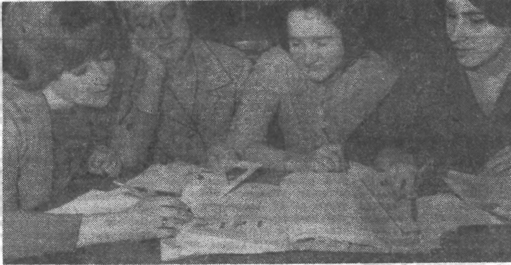
Студентки 408-й группы готовятся к зачету по курсу «Основы информационной техники».