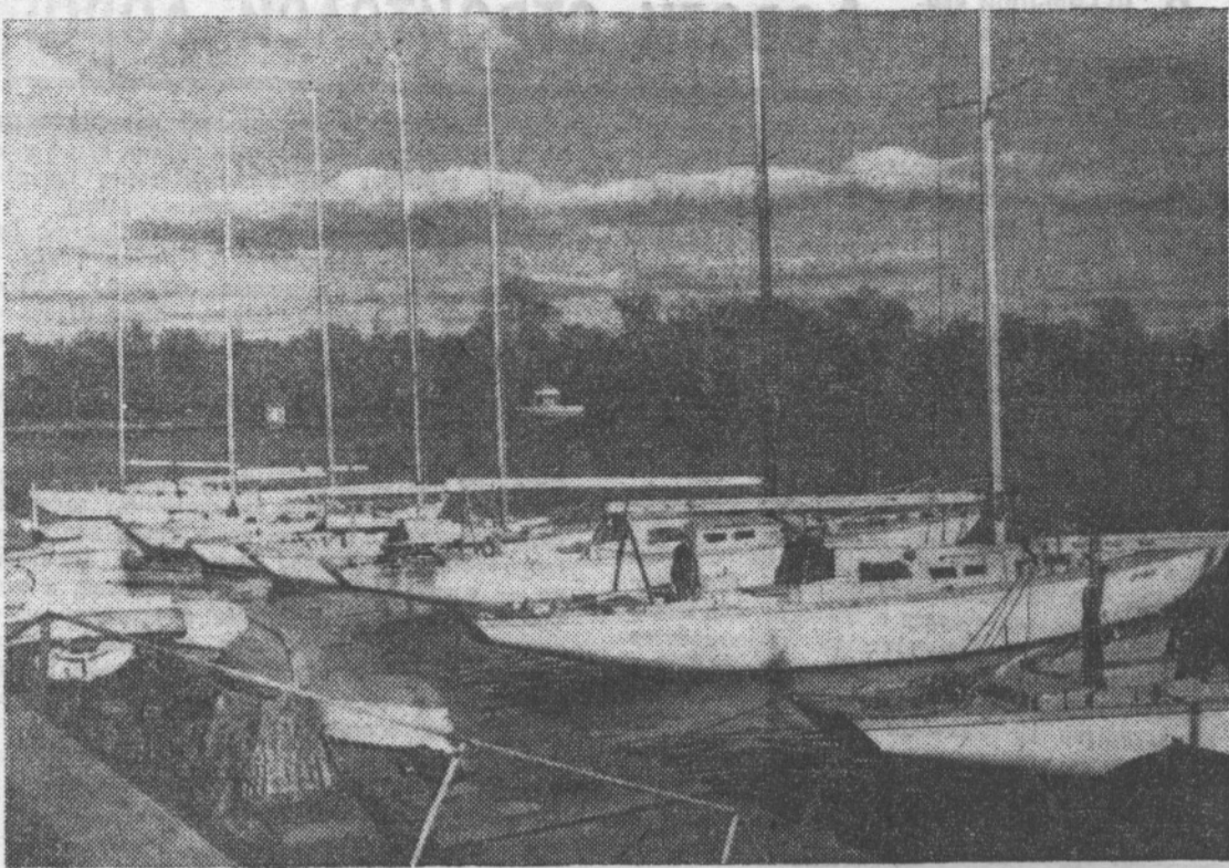
На пирсе Петровского яхт-клуба.