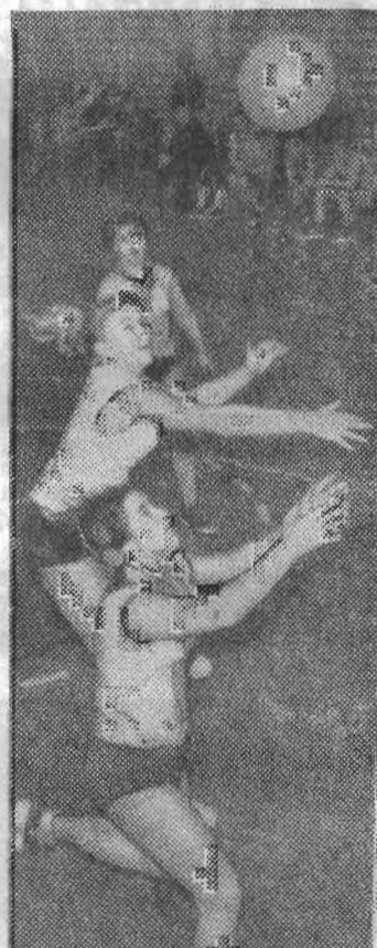
Баскетбол, пожалуй, самый популярный вид спорта в институте. Из года в год коллектив ЛИТМО выходит победителем в чемпионате Ленинграда среди студентов, а лучшие игроки выступают в составе сборных Ленинградского «Буревестника» в чемпионате страны по классу «А».

«День открытых дверей» в главном здании института (пер. Гривцова, 14) будет проведен в воскресенье, 15 мая. Он начнется в 12 часов.