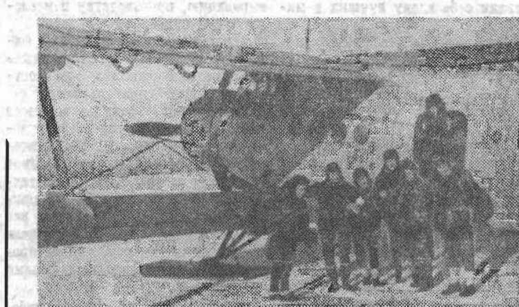
В отдаленных таежных районах Коми АССР побывал агитотряд ЛИТМО.

Интересные дела ожидают литмонавтов нынешним летом. Отряды студентов-строителей примут