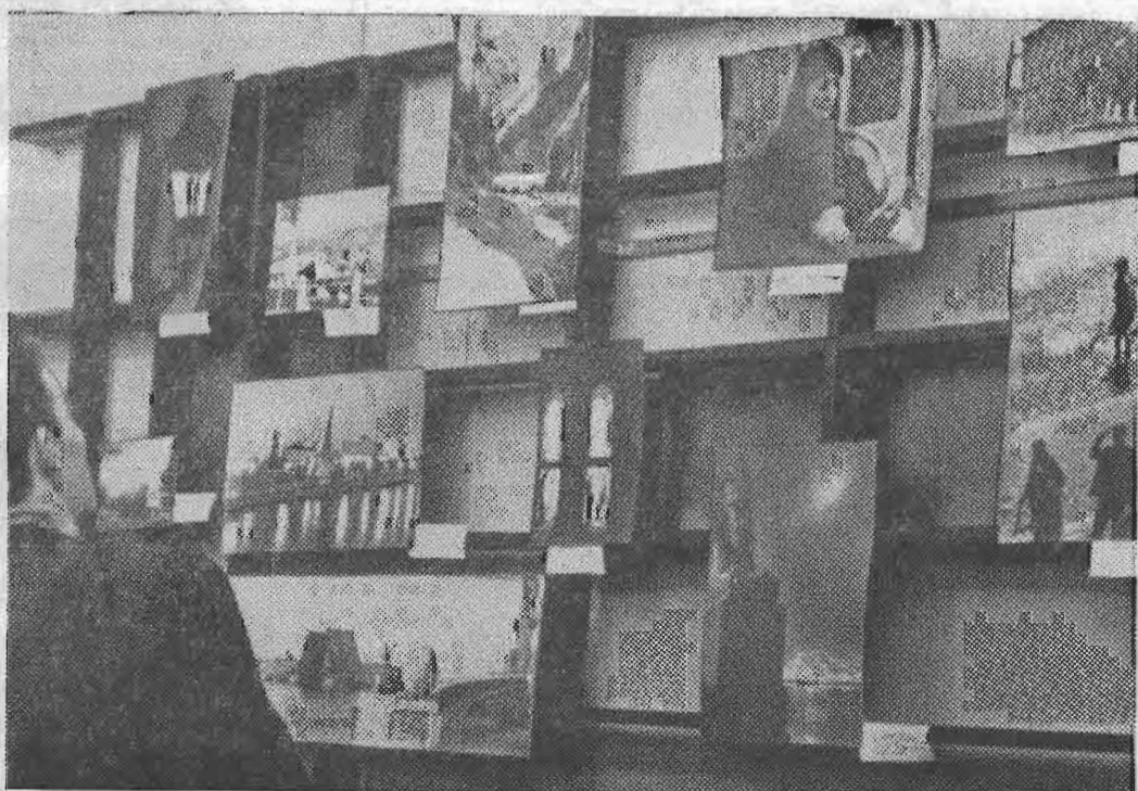
Общий вид экспозиции выставки в общежитии.