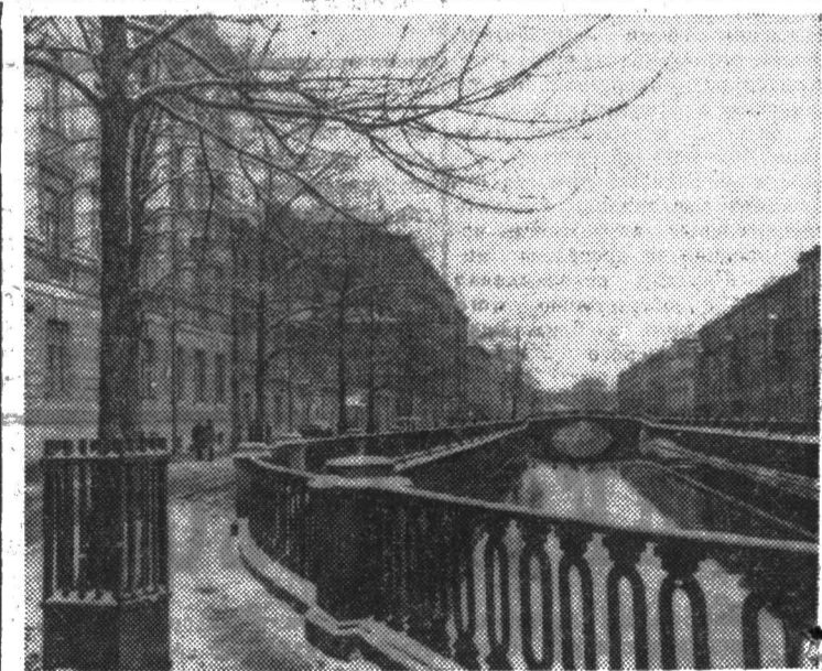
С первым снегом!