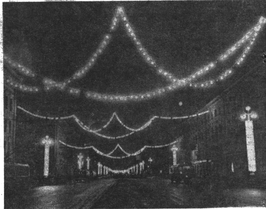
ЛЕНИНГРАД ПРЕДПРАЗДНИЧНЫЙ.

ПОЧТИ три недели продолжалось первенство общежития на Вяземском по футболу. В турнире были представлены команды всех четырех мужских этажей.