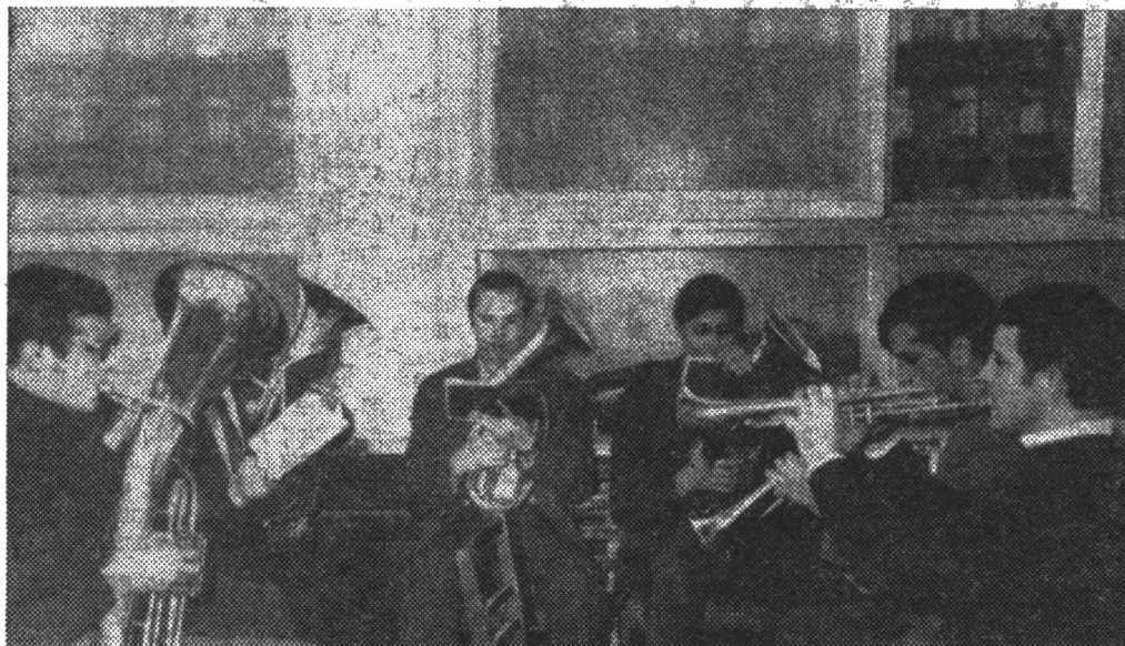
ДУХОВОЙ ОРКЕСТР — НЕПРЕМЕННОЕ УЧАСТИЕ ВСЕХ ИНСТИТУТСКИХ ТОРЖЕСТВ.