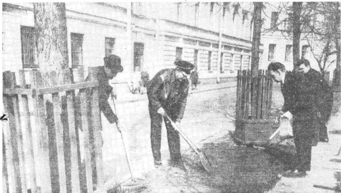
Сотрудники военной кафедры на всесоюзном Ленинском субботнике.

На проходящих сейчас по всей стране собраниях трудящихся называют своими кандидатами в состав высших органов государственной власти республик лучших людей нашей страны. На всех собраниях в числе первых кандидатов в депутаты единодушно названы Генеральный секретарь ЦК КПСС Л. И. Брежнев, Председатель Президиума Верховного Совета СССР Н. В. Подгорный, Председатель Совета Министров СССР А. П. Косыгин, члены Политбюро ЦК КПСС. Среди кандидатов — передовые рабочие, колхозники, представители советской интеллигенции, партийные работники, военнослужащие.