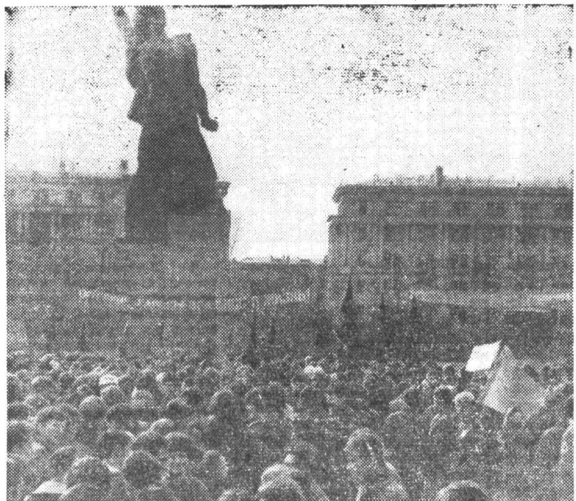
Студенты-строители ЛИТМО на общегородском митинге на Комсомольской площади.