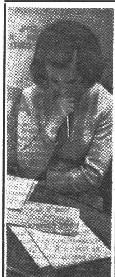
ТРУДНЫЙ БИЛЕТ. Фотоэтид З. САНИНОЙ

Организация самостоятельной работы студента требует от преподавателя знания педагогики и психологии, очень серьезной методической работы. У нас часто под методической работой понимают только отбор материала, необходимого для изучения студенту, написание различных методических руководств для выполнения лабораторных работ и курсовых проектов и т. д. Но ведь это только часть работы, очень важная, но не основная. А основной методической работой являет-