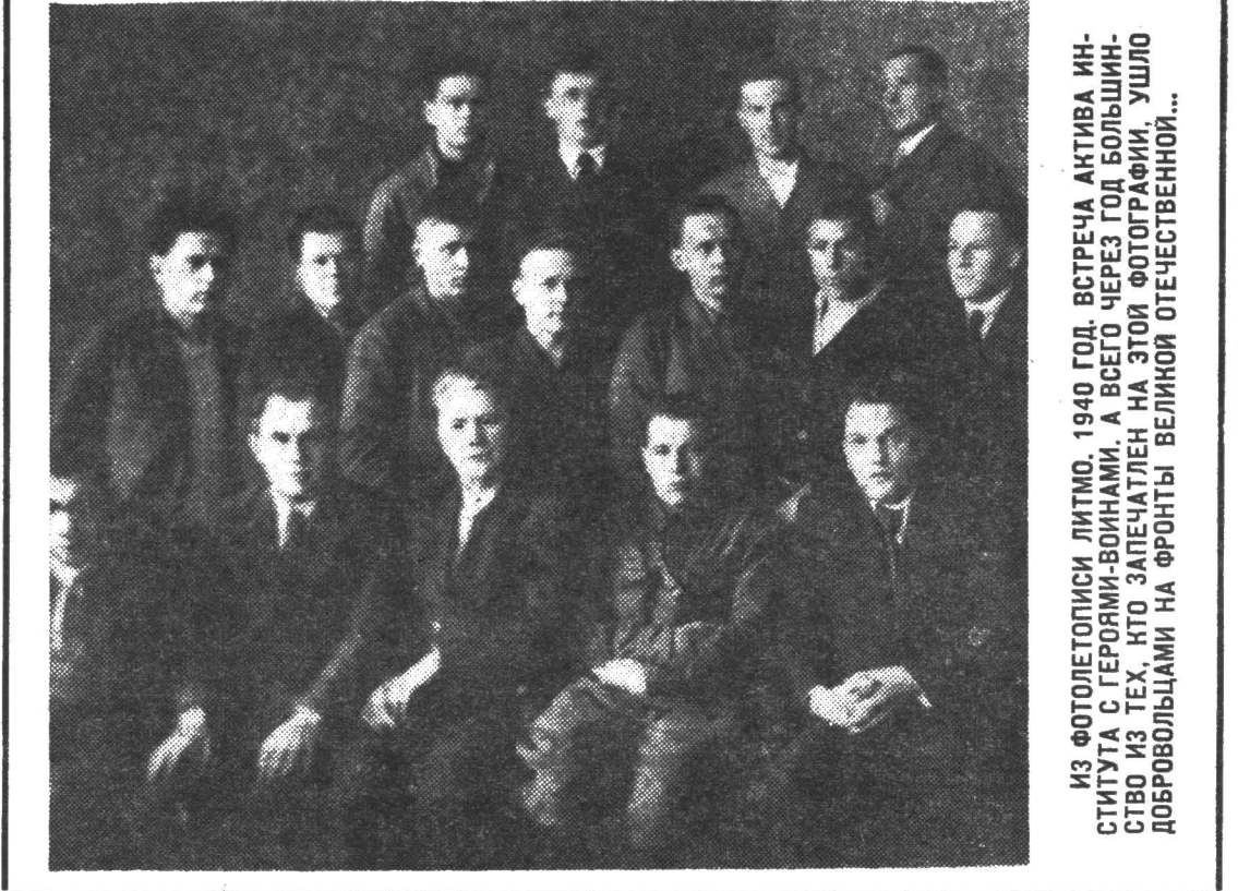
ИЗ ФОТОЛОПИСИ ЛИТМО. 1940 ГОД. ВСТРЕЧА АКТИВА ИНСТИТУТА С ГЕРОЯМИ-ВОИНАМИ. А ВСЕГО ЧЕРЕЗ ГОД БОЛЬШИНСТВО ИЗ ТЕХ, КТО ЗАПЕЧАТЛЕН НА ЭТОЙ ФОТОГРАФИИ, УШЛО ДОБРОВОЛЬЦАМИ НА ФРОНТЫ ВЕЛИКОЙ ОТЕЧЕСТВЕННОЙ...

53-ю годовщину армии и флота наш народ и его воины встречают в обстановке высокой трудовой и политической активности,