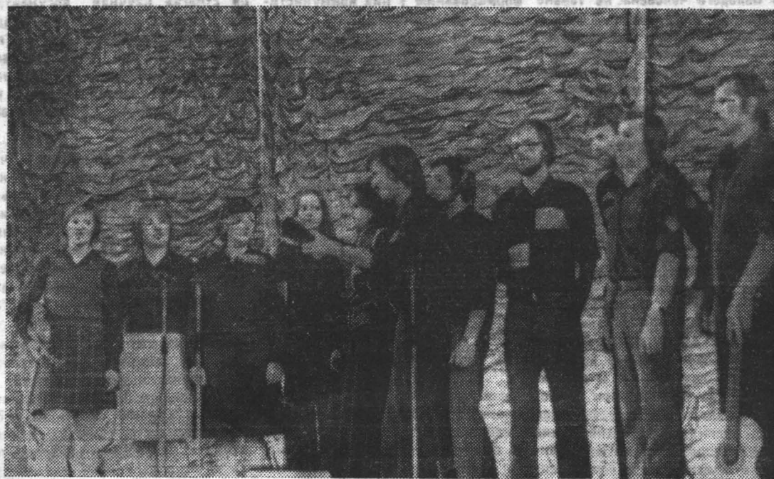
Вечер интернациональной дружбы. Выступает студенческий ансамбль ГДР.