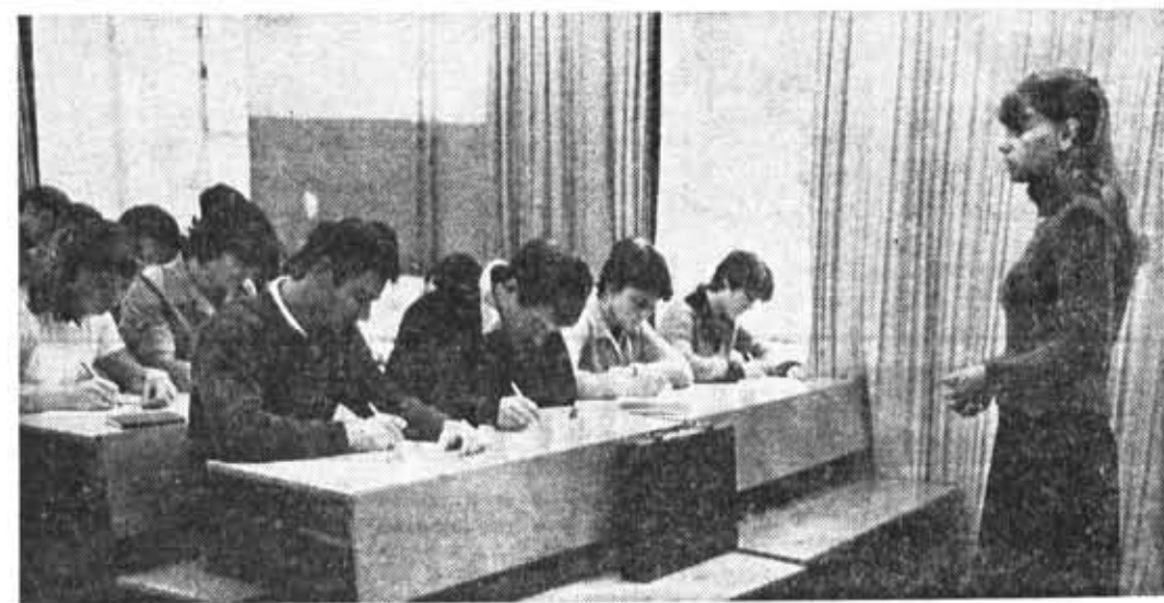
Создание на кафедре иностранных языков лингвистических кабинетов значительно облегчило студентам овладение разговорной речью. На снимке слева: первокурсники изучают английский язык. Заканчивая изучение предметов общественно-