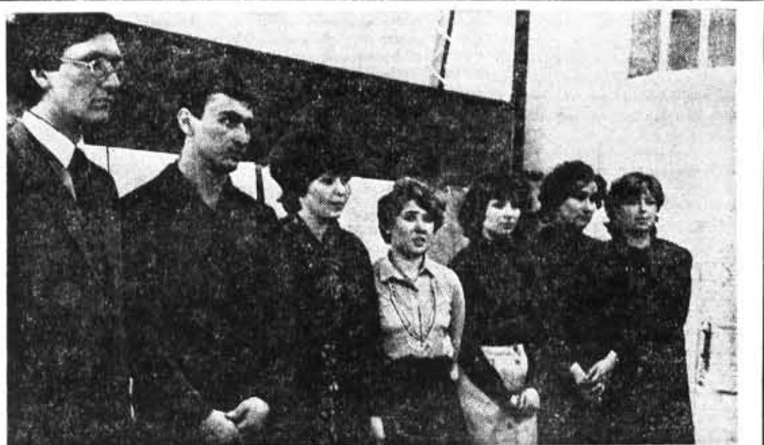
Вечернее отделение института готовит для народного хозяйства страны молодых специалистов, которым практически не потребуется период адаптации на производстве. На снимке: группа выпускников-вечерников нынешнего года по специальности «Оптико-электронные приборы».

А. ДЕМИДОВ , член совета института по НИРС