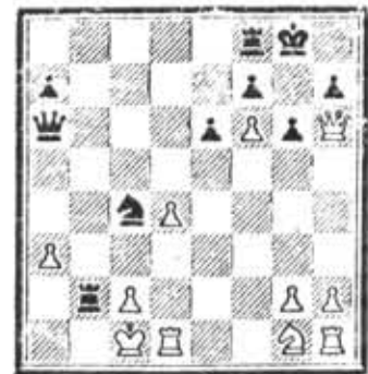
Игра началась. После каждого хода эсэсовца, который тот обдумывал столько, сколько хотел, полицай толкали в бок Леню — «ходи».

РАЗЫГРАННАЯ партия эта была опубликована в журнале «Шахматы в СССР» в 1967 году. Ее ход удалось восстановить с помощью оставшихся в живых свидетелей.