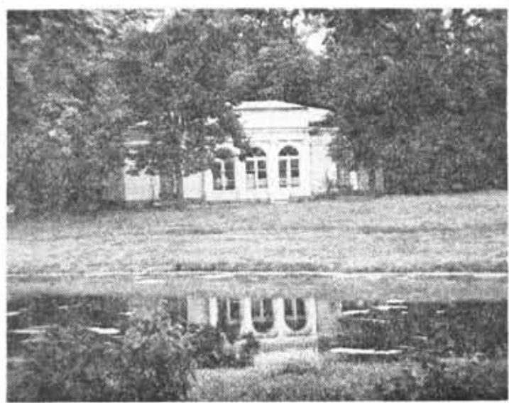
В Екатерининском парке г. Пушкина.

Трубят, трубят твои потомки, и в их сердцах бессмертен ты.