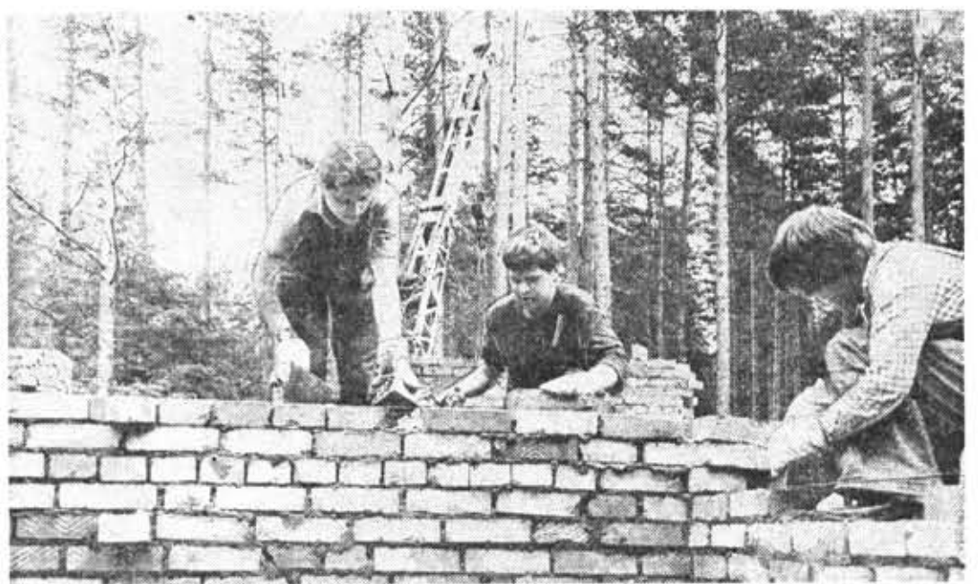
Много сделано для реконструкции спортивно-оздоровительного лагеря ЛИТМО в Ягодном студенческий строительный отряд.

Говорили и о недостатках услышанного: слабо раскрыта многообразная тематика жанра, отсутствует цельное представление о его специфических особенностях. Очевидно, сложность коренится в условности самого названия — «политпесня», ибо жанр этот, зародившийся в капиталистических странах, персона-