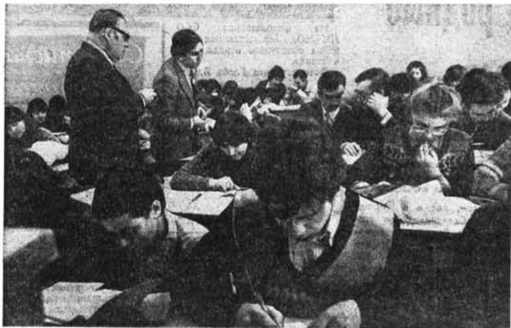
Пятикурсники выполняют конкурсное задание олимпиады по специальности «Вычислительная техника».

Е. ШАЛОБАЕВ, старший преподаватель кафедры ТМДП