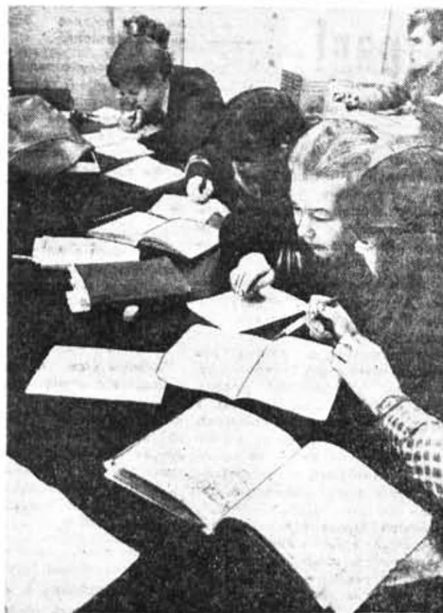
Студенты 261-й группы на зачете по теоретической механике.

В МАЕ ПРОШЛА городская межвузовская олимпиада по истории, героическому прошлому и настоящему нашего города. Команда ДИТМО заняла на ней третье место. И мне хочется рассказать о том, как мы готовились, как выступали.