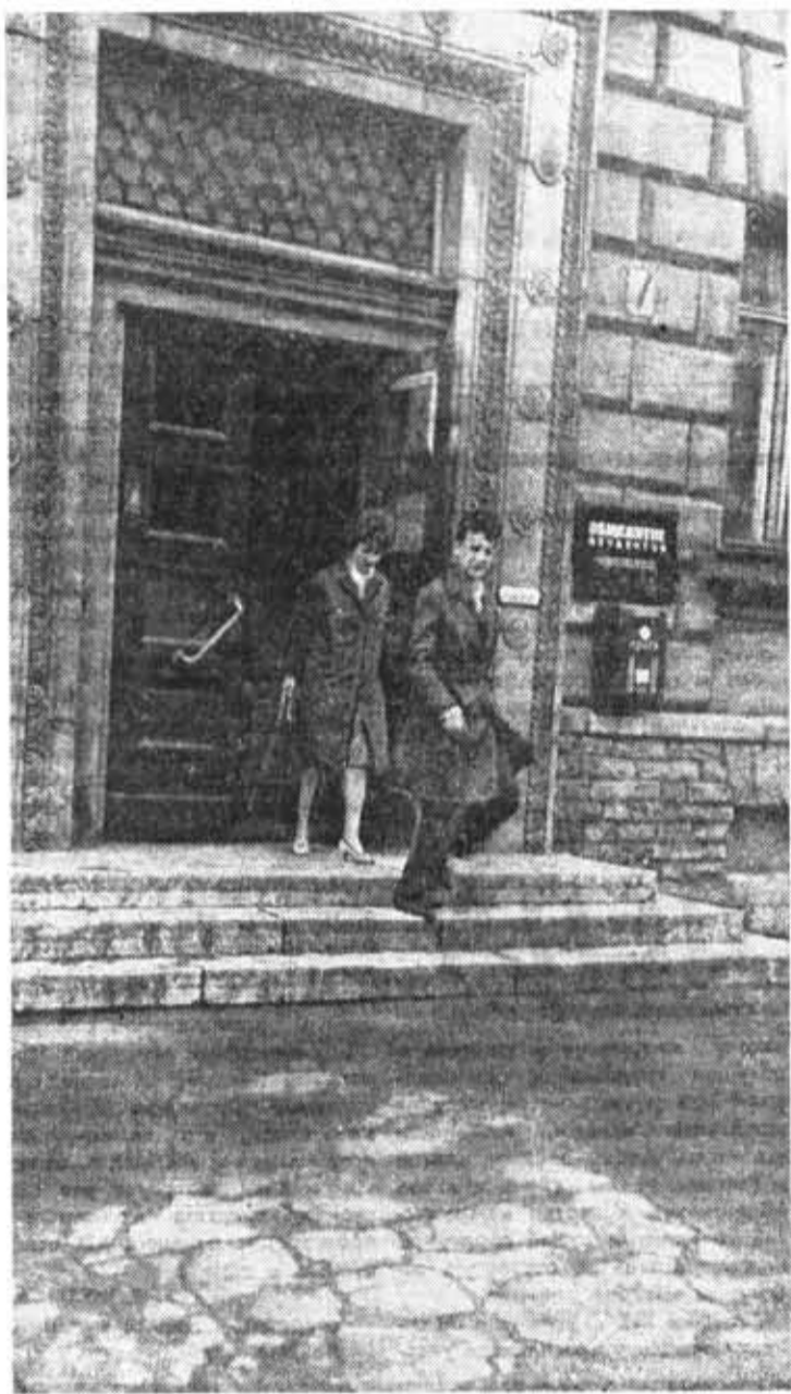
В ранний утренний час на Вяземском.

ПРОБЛЕМЫ организации быта и отдыха в студенческих общежитиях института постоянно находятся в центре внимания ректората и общественных организаций института. Они станут предметом обсуждения общестуденческого партийного собрания. И в нашей редакционной почте нет недостатка в материалах, затрагивающих различные стороны многогранной жизни студенческого дома.