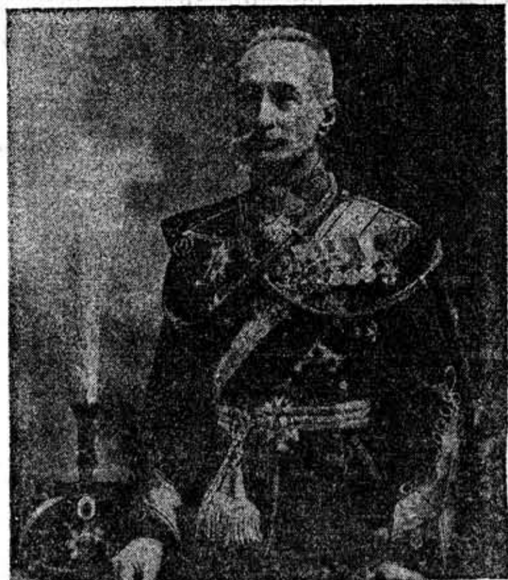
Генерал русской армии А. А. Брусилов.

Первое упоминание о гривне как знаке отличия мы находим в Никоновской летописи. «В лето