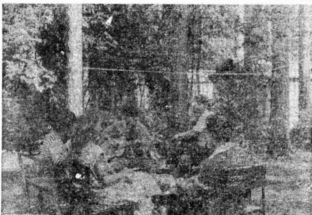
Лезвие порезов в Ягодном.

На мой взгляд, сейчас нам не хватает веры в себя и вообще веры во что-то великое. Не к чему стремиться. Революция 17 года разбила (пыталась разбить) религиозные идеи. Вместо икон стали появляться портреты Маркса, Ленина, Сталина. Но несмотря на все негативные стороны, у людей была вера в светлое будущее, что помогло выстоять и преодолеть многие беды. Сейчас идеалы революции растоптаны. Вот почему сегодня следует отглынуться на несколько веков назад к истокам русской культуры и духовности. Жизнь преподобного Сергия Радонежского и по сегодняшней день — путь к истине. Кто знает, может отчаявшийся и потерявший себя человек, придя в Троице-Сергиеву Лавру к мощам преподобного, вновь обретет веру и почувствует жизненные силы? Вспоминаются слова протоиерея Сергия Булгакова, который считает, что Сергий Радонежский был связан с особыми обстоятельствами своего времени, но он и поныне воздействует на нашу эпоху, ибо дух человеческий, обращаясь к Богу находится вне времени, в котором осуществляет творческие замыслы. И мы призваны духовно следовать путем преподобного Сергия, вдохновляться его вдохновением. Не обязательно ждать, что кто-то поведет тебя за собой, даст моральный стимул. Может следует всего лишь попробовать последовать примеру Сергия — жить ради ближнего, работать над собой или просто поверить во что-нибудь чистое и святое!