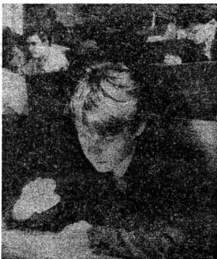
На вступительном экзамене по математике.