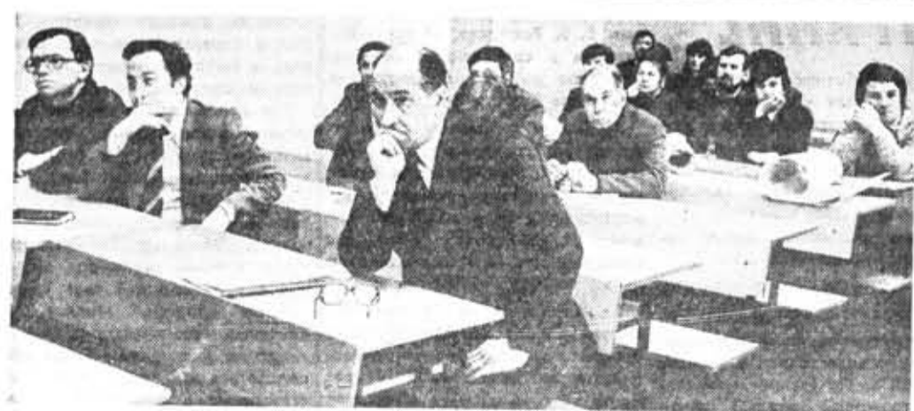
На XXV научно-технической конференции профессорско-преподавательского состава института. Заседание секции автоматизации процессов проектирования и производства.

Проведение в институте подобных работ позволило планомерно наладить работу по подготовке кандидатов и докторов наук. Так,