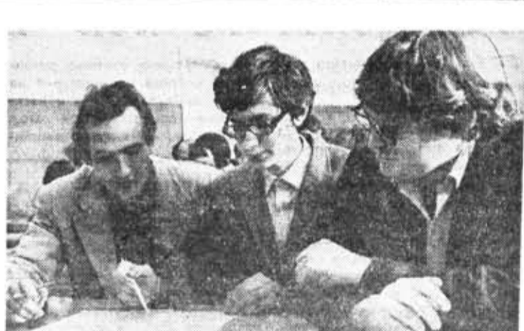
На вступительных экзаменах по математике.