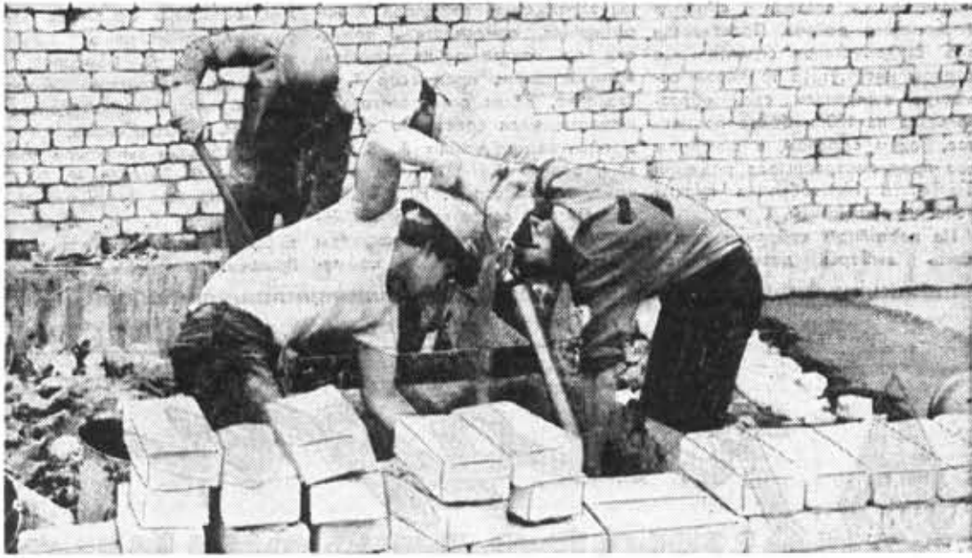
Бойцы интернационального отряда «Товарищ» готовят строительный раствор.

шо, и строители остались довольны нашей помощью. Вместе с нами работали наши друзья из Чехословацкой Социалистической Республики. В июле мы принимали студентов Высшей школы из города Кошице [ЧССР], а в августе — студентов университета из города Йена [ГДР].