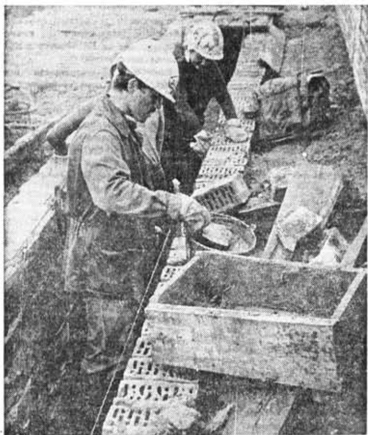
Конкурс каменщиков в ЗССО «Гатчинский».