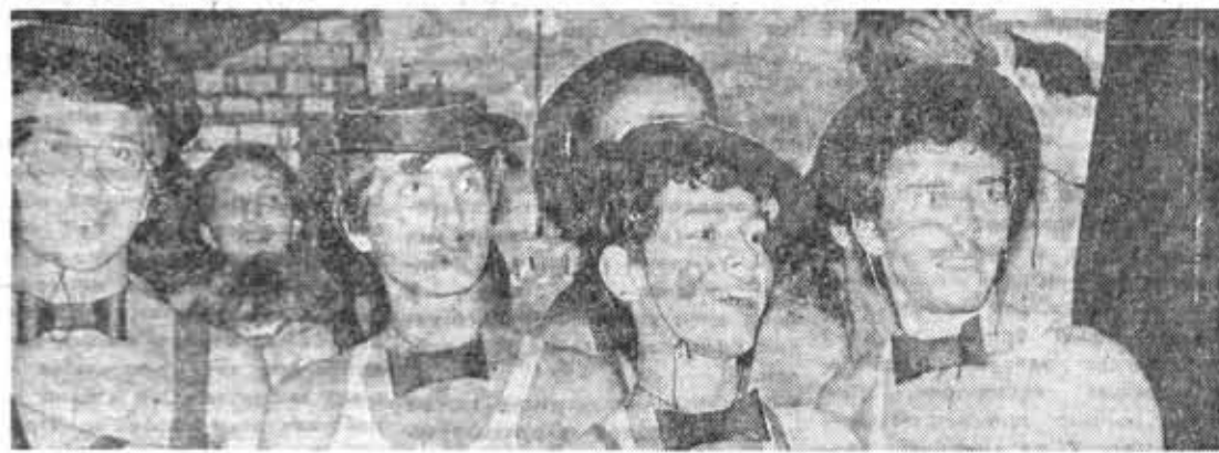
В каждом стройотряде складывается своя традиция веселых празднований, сопровождающих начало и окончание трудового года.

Контрольно-комбинированный маршрут, на котором участ-