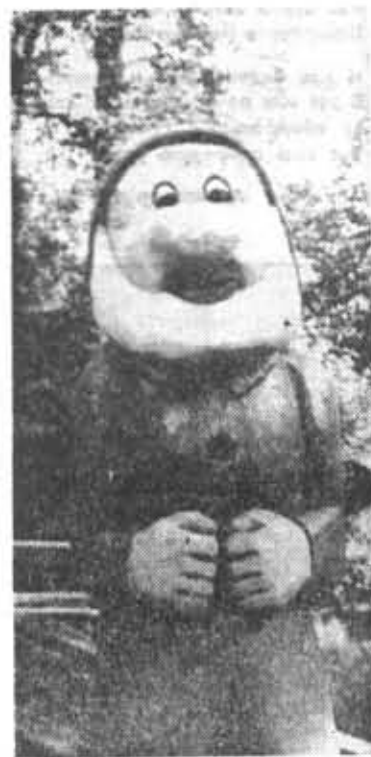
На игровой площадке на Каменном острове, построенной ССО «Гном».

Г. ВЫЖИМОВА, заведующая детским садом № 10