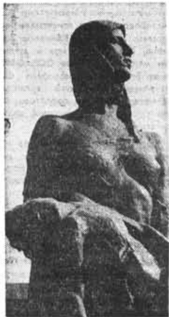
На Пискаревском кладбище

Город — море огней, Драгоценных камней, Голубых, золотых и зеленых. Задремал Ленинград. У чугунных оград Бродят нежные пары влюбленных. Ты меня не морочь, Ленинградская ночь, Анварельной гармонией красной! Я забыть не сумел Огневой артобстрел И глухие разрывы фугасок. Над уснувшей рекой — Величавый покой. И, казалось, грустить мне о ком бы! Слышен мне над Невой Отвратительный вой Самолетами сброшенной бомбы. Тихо город уснул, Но мне слышится гул Непрерывной ночной канонады, В мире пазнет войной — И встают предо мной Ночи злой ленинградской блокады. Не забыть никогда, Как нависла беда Над пустыми глазницами окон. Наглый, вострый враг Не сорвал алый флаг, Одолеть ленинградцев не мог он! И сейчас в тишине Мысль твердит о войне: Пусть пред нею возникнет преграда! Пусть костлявой рукой Не нарушит покой Серебристых ночей Ленинграда!