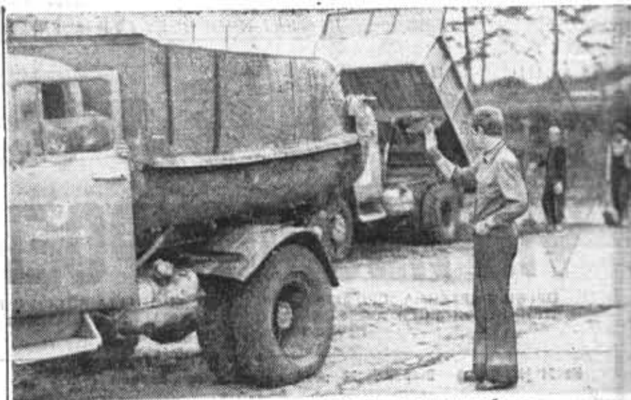
Из фотолетписи ССО. На дорожных работах.