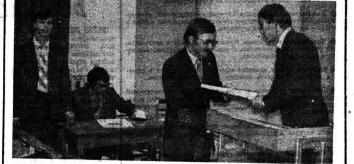
Вручение почетных грамот активистам на профсоюзной конференции ФТМВТ.

Нам надлежит с большей настойчивостью и последовательностью заботиться о здоровье студентов. Профсоюзной студенческой организацией периодически