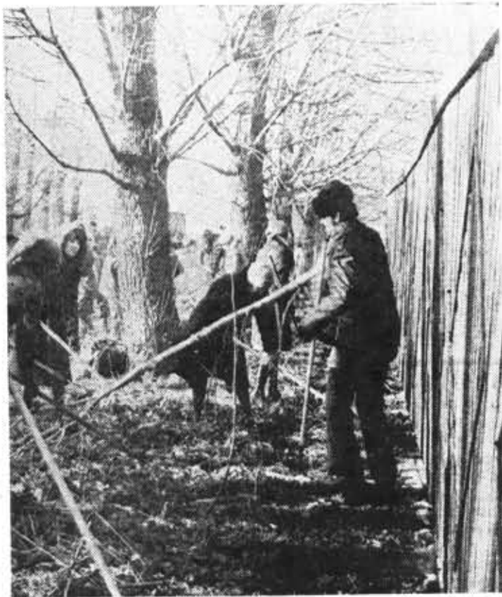
Студенты оптического факультета на благоустройстве парка.

НОВЫМИ достижениями во всех сферах жизни общества встречают советские люди предстоящий XXVI съезд КПСС. Высокие обязательства к этой знаменательной дате приняли активисты ВООП Петроградского района. Решено провести «Эстафету природоохранных добрых дел». Этот почин подхватили все первичные организации нашего общества на предприятиях, в учреждениях, в учебных заведениях.