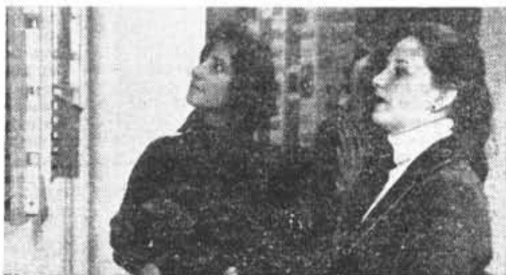
Фоторепортаж З. Саминной.