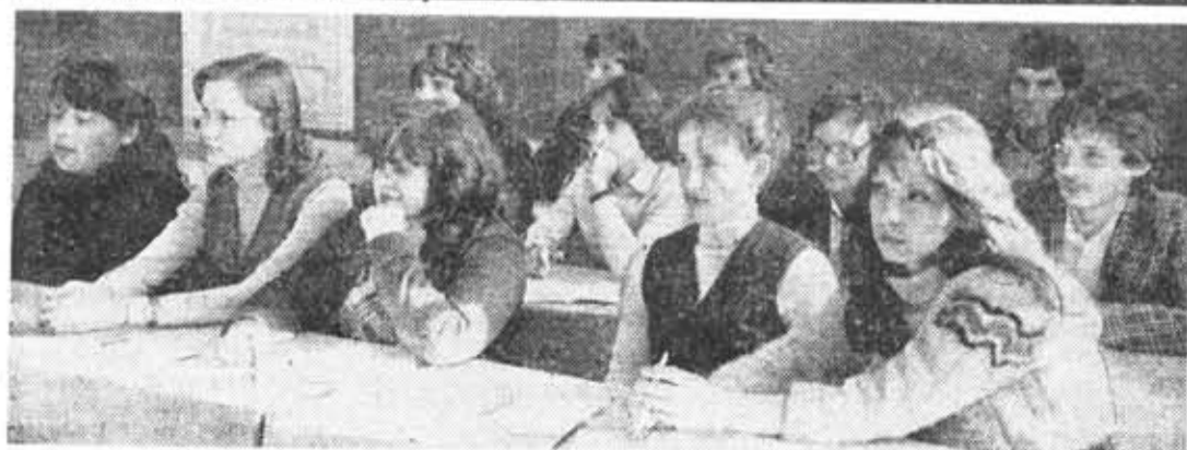
Учебные будни. Первокурсники из 130-й группы на практических занятиях по высшей математике. Что нового в расписании?

Ю. ШНЕЙДЕР, профессор, руководитель сектора по науке головной группы народного контроля