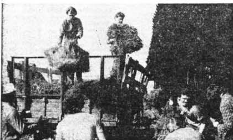
Из фотолетописи ССО ЛИТМО.

Кроме того, ученые ЛИТМО выступали с докладами на заводах, широко практиковались консультации для работников промышленности. В сентябре 1944 года институт начал перебазирование обратно в Ленинград. П. МАКЕЕВ