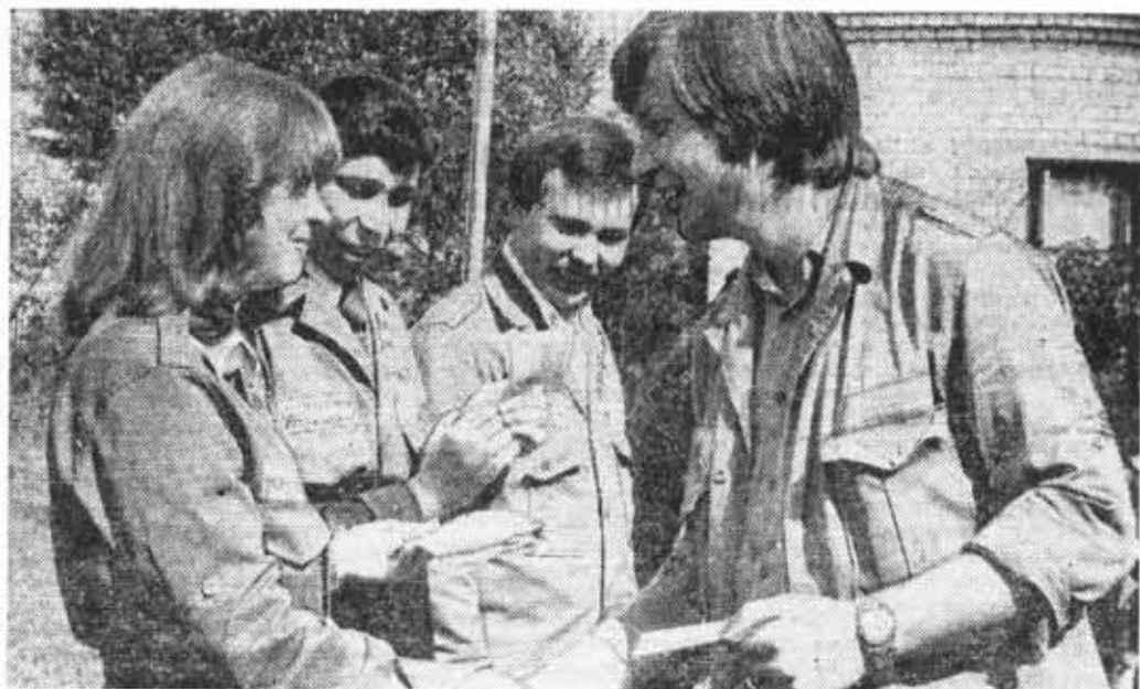
Стройки третьего семестра — лучшая школа трудовой закалки студентов, которым предстоит руководить коллективами на производстве.

Теперь на повестку дня поставлен другой существенный