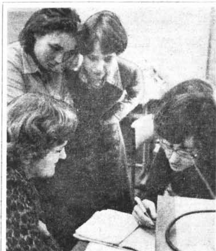
Учебные будни. На кафедре автоматики и телемеханики.