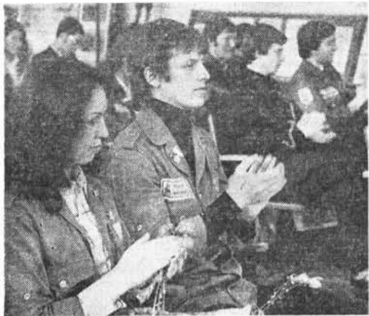
На торжественном заседании актива РССО «Гатчинский» в музее Великой Октябрьской социалистической революции.