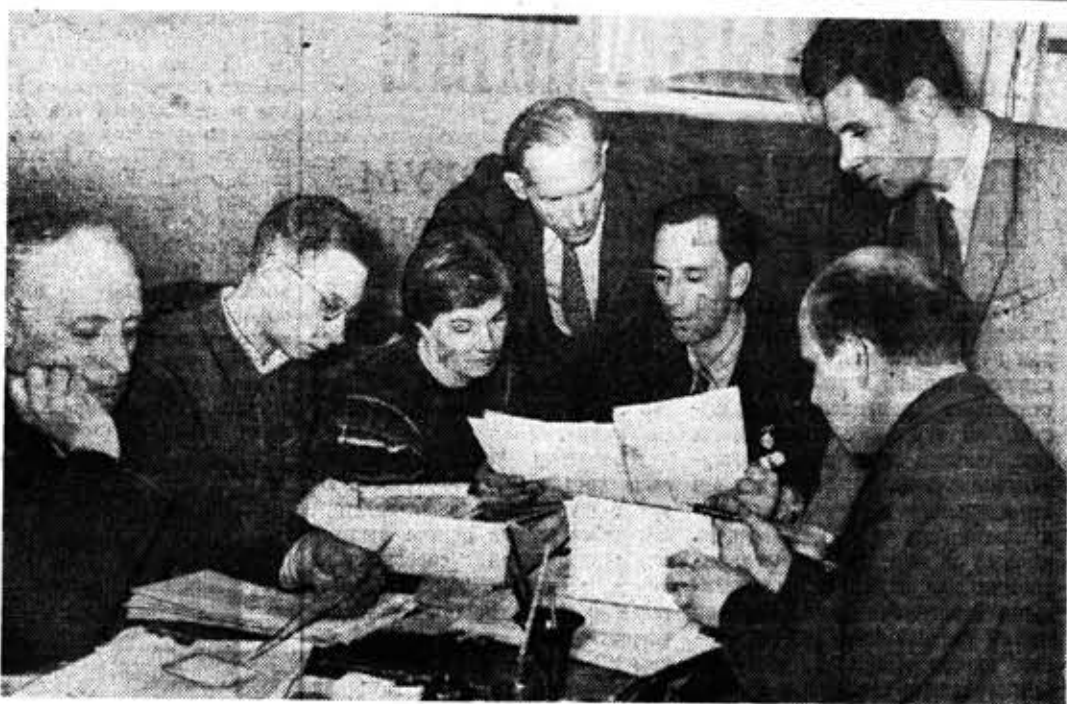
1957 г. После перерыва, вызванного событиями военных лет и эвакуацией института, возобновилось издание в ЛИТМО многотиражной газеты.