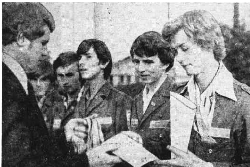
Вручение призов студентам ЛПИМО — победителям районной спартакиады в Гатчине.

бойцов отряда будет способствовать освоению природных бо-