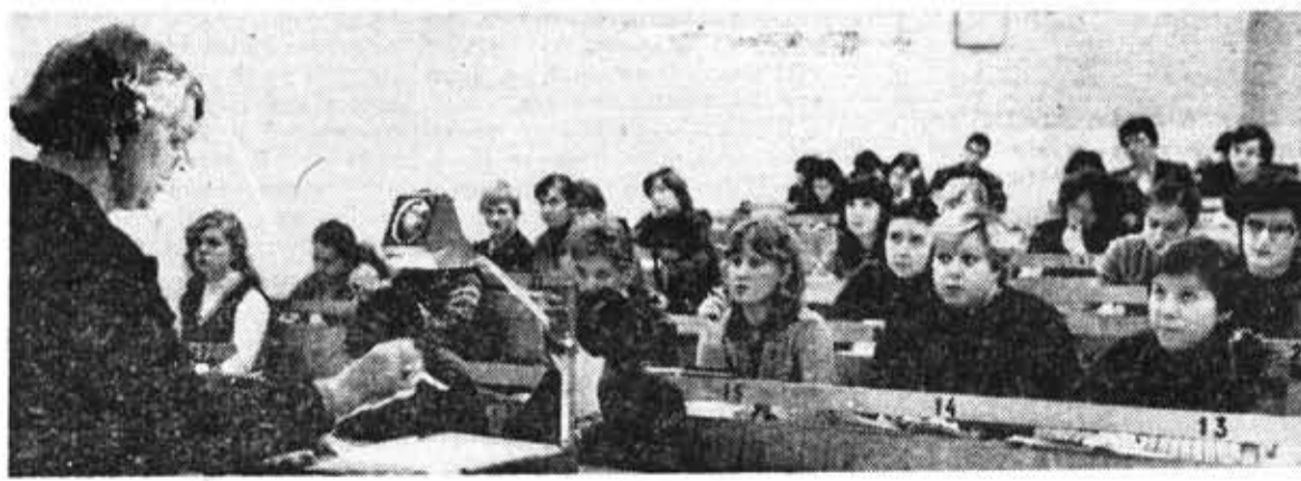
Лекцию для четверокурсников инженерно-физического факультета читает профессор И. М. Нагибина.