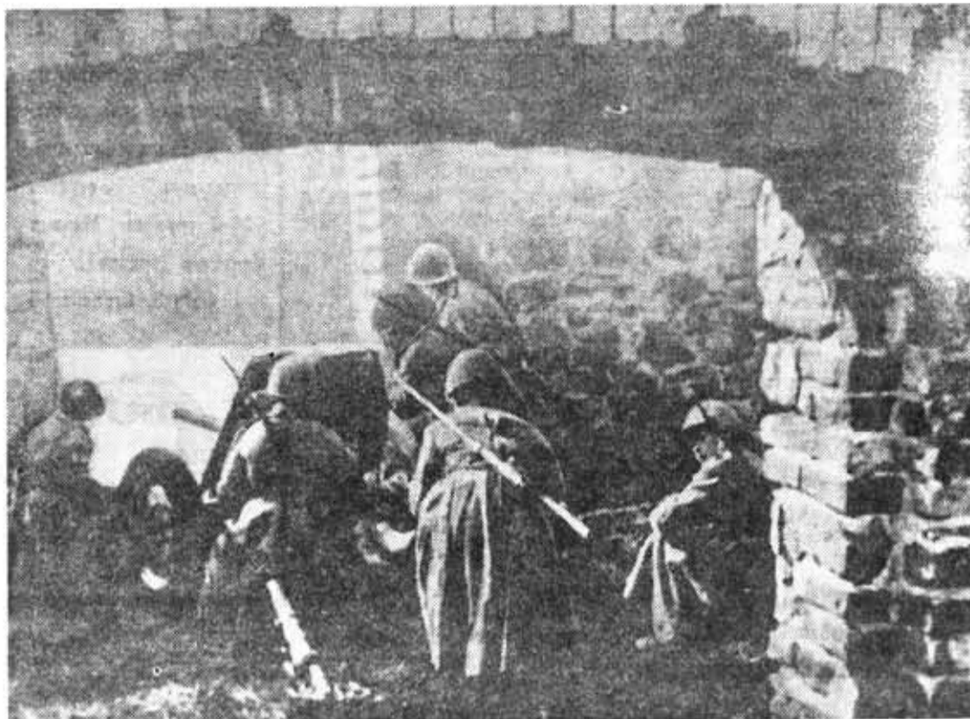
1944 год. Западнее Луги. Артиллеристы в бою за населенный пункт.

9 февраля был взят населенный пункт Толмачево. Здесь полк форсировал Лугу. На реке, покрытой льдом, неокорванным минами и снарядами, топили машины с людьми. Пришлось в считанные часы навести переправу длиной в сотню метров и сходу выйти к городу.