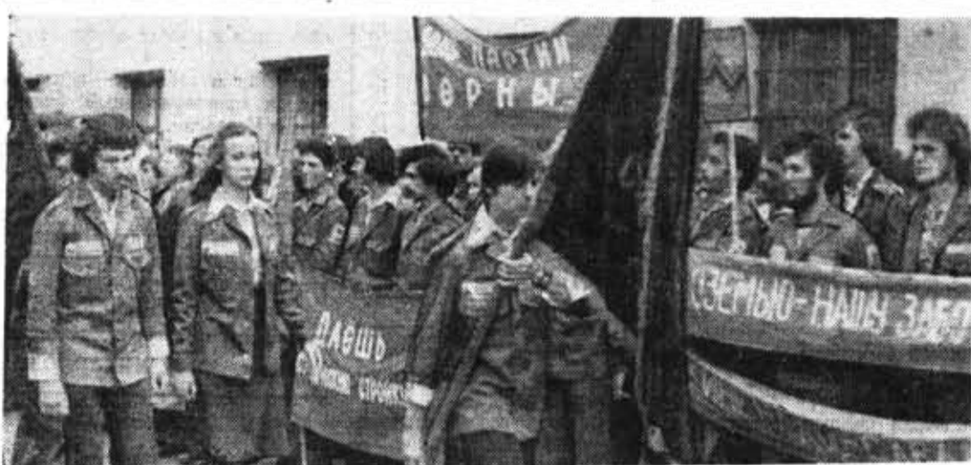
Торжественный марш лямонзавтов — наследников боевых традиций старшего поколения.

А ДОРОГИ ВОЙНЫ шли все вперед. Бои на Псково-Островском направлении, форсирование реки Великой, Изгнание фашистов из южной Эстонии. Полк за образцовое выполнение боевых заданий, за героизм и мужество, проявленные в разгроме танковой группировки врага в районе д. Тамса, за активное участие в боях за город Тарту и за ряд отличных проведенных операций Указом Президиума Верховного Совета СССР от 7 сентября 1944 года был награжден орденом Красного Знамени.