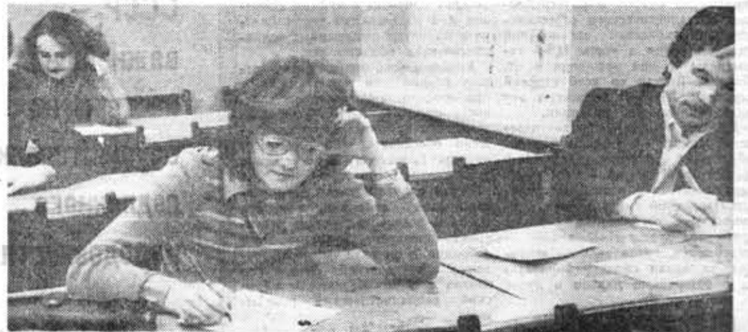
Пятикурсники оптического факультета сдают экзамен на кафедре экономики промышленности и организации производства.