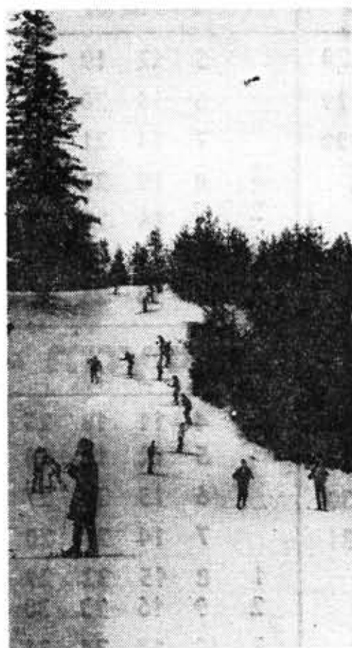
Лыжная вылазка на Карельский перешеек. Фото студентки Ирины Боголюбовой