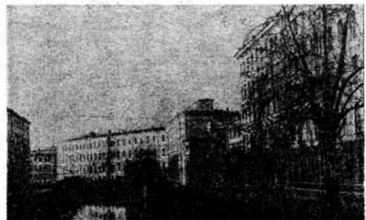
Вид на здания ЛИТМО с канала Грибоедова.

же находились бухгалтерия и касса, а в первом и третьем этажах располагались жилые комнаты служащих банка.