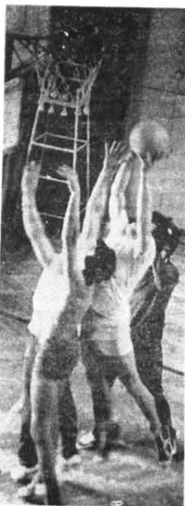
Среди разнообразных состязаний, проводимых спортклубом, есть и такое, как матчевые встречи по баскетболу между командами профкома и комитета ВЛКСМ.

Талант, бесспорно, дар природы и потому из ее сынов. Талантливый человек должен быть признателен за то и земле, плодами которой питались его предки, и