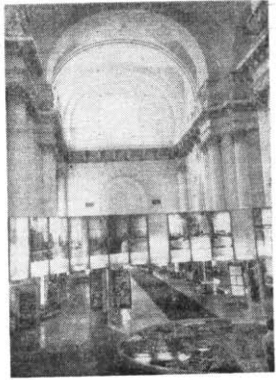
завтра». Посетители музея знакомятся с планами строительства и реконструкции нашего города на ближайшее десятилетие.

ных талантливых людей при их жизни или посмертно, ворожа письма, дневники или сомнительной достоверности воспоминания современников, чтобы подкрепить фактами чудовищную «теорию» Ломброзо. Они осаждали живого Льва Толстого, высказывая всеческие недуги у этого не только духовно, но и физически крепкого человека. Они возводили гаусейшие небывалы на Гоголя, Достоевского.