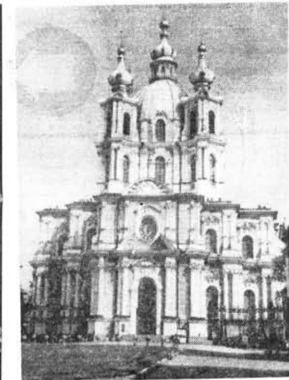
В замечательном памятнике архитектуры — Смольнинском соборе — открыт филиал Музея истории Ленинграда. Здесь развернута постоянно действующая экспозиция «Ленинград сегодня и

О «тайне» таланта написано много книг, создано много самых различных, часто очень вздорных теорий. В прошлом столетии итальянский писатель Цезарь Ломброзо заявил, что гений содержит в себе нечто патологическое, большое. И вот десятки литераторов, ученых, досужих журналистов стали терзать несчаст-