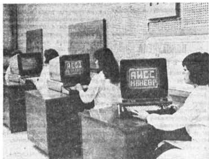
Учебные будни. Занятия в дисплейном классе.

Чаще всего предоставляется первоочередное право на обеспечение путевками в детские сады, пионерские лагеря, сельские участки, приобретение легковых автомобилей и других дефицитных товаров. Во многих случаях отличившихся выдвигают в первую очередь на получение государственных наград, присвоение почетных званий данному предприятию, занесение в Книгу почета. Заслуживает одобрения практика дифференцированного поощрения с учетом интересов разных категорий работников — молодежи, ветеранов труда.