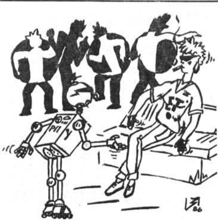
— Вы запрограммированы на брейк или флэш! Изошутка студента 528-й группы Игоря Звягина