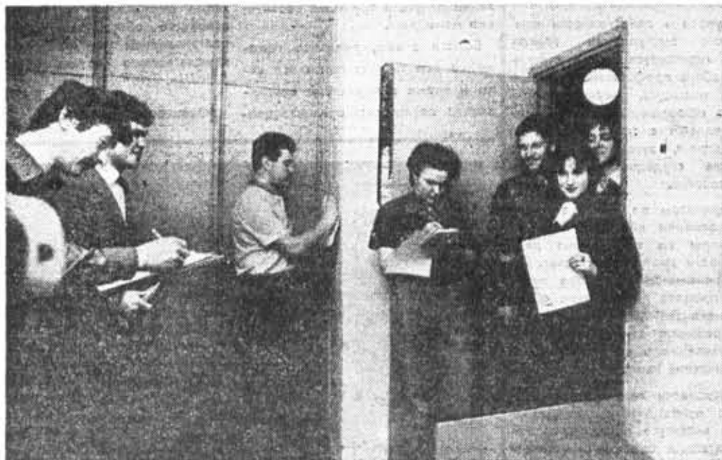
Общественное жюри подводит результаты конкурса на лучшую комнату в студгородке на Вяземском.