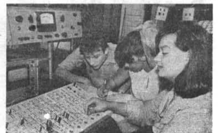
Студенты оптического факультета на практических занятиях по цифровой электронике.

Партийный комитет дал критическую оценку работе редакции газеты «Кадровые приборостроению». Не достигнут еще требу-