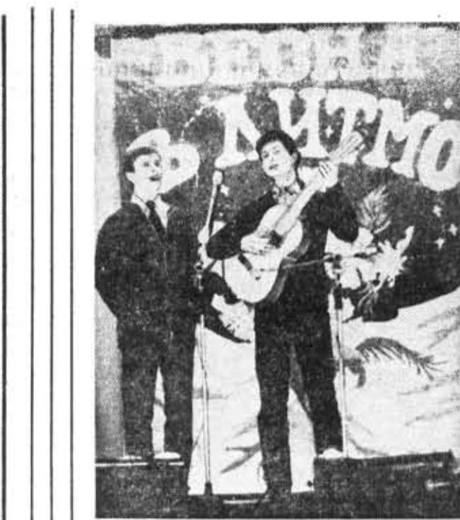
Своя гитара, своя мелодия, свои слова. На институтском конкурсном вечере.

В БИБЛИОТЕКУ института поступила следующая новая литература по технике: