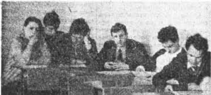
Как сделать газету интересней? Есть над чем призадуматься!

Сегодня здесь собрались 15—20 человек, для которых судьба газеты безразлична. Думаю, что если все вы объедините свои усилия и с огоньком приметесь за дело, перемены к лучшему не заставят себя ждать. Конечно, важно не то, чтобы под каким-то количеством заметок