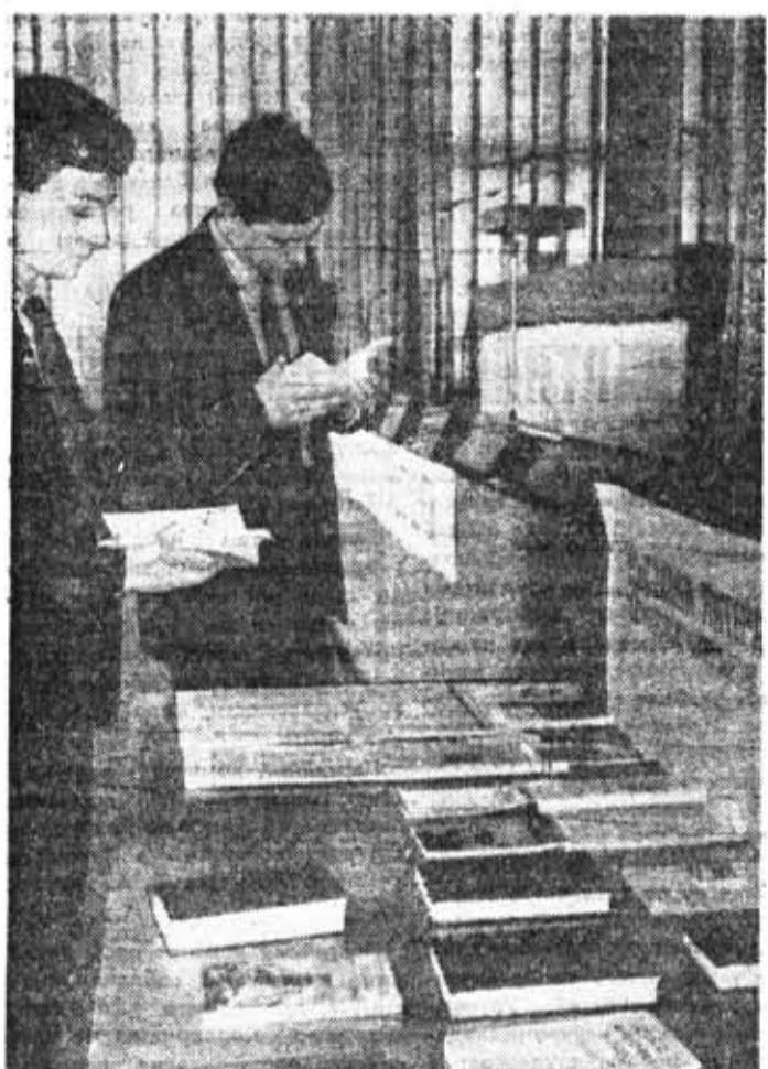
Во время месячника оборотно-массовой работы в институте была организована выставка военно-патриотической литературы.

Решительный отказ от самоуспокоенности, трафаретности, утверждение атмосферы поиска, обновления форм и методов пар-