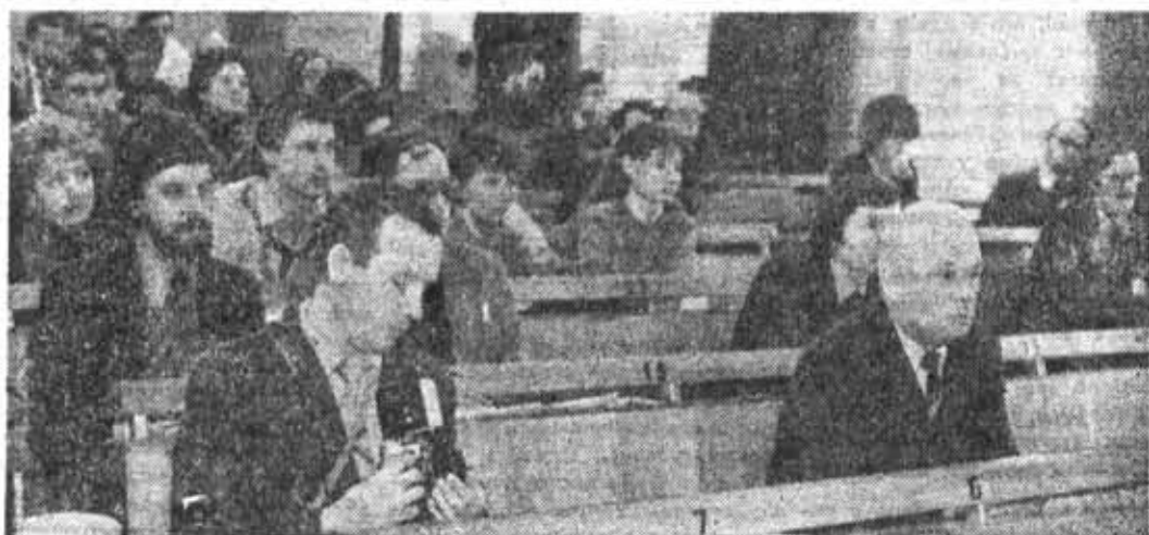
В дни студенческих каникул в институте прошла научно-техническая конференция профессорско-преподавательского состава. На снимке: заседание секции оптического приборостроения.