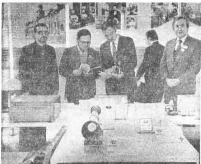
У стендов ЛИТМО на выставке научного и технического творчества студентов Ленинграда, посвященной XXVII съезду КПСС.