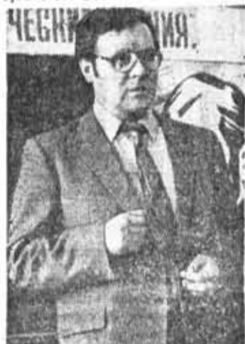
ре относятся и к научной работе.

ЗАДАЧИ, поставленные на апрельском (1985 г.) и октябрьском (1985 г.) Пленумах ЦК КПСС перед инженерно-техническими и научными работниками, всем советским народом, поистине впечатляющие. Партия ставит задачу превратить науку в подлинный катализатор ускорения научно-технического прогресса. Речь идет о коренном повышении уровня эффективности исследований, быстром внедрении их результатов. Все это в полной ме-