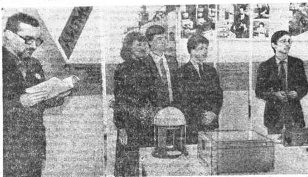
На открытии выставки студенческого научного творчества в Гавани. У стендов