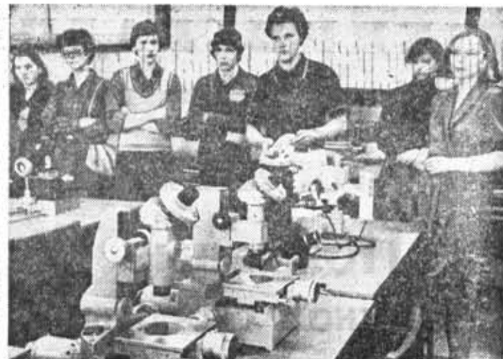
День открытых дверей на кафедре теории оптических приборов.

А. КОРОЛЬЧУК, доцент, партгрупорг кафедры технологии приборостроения