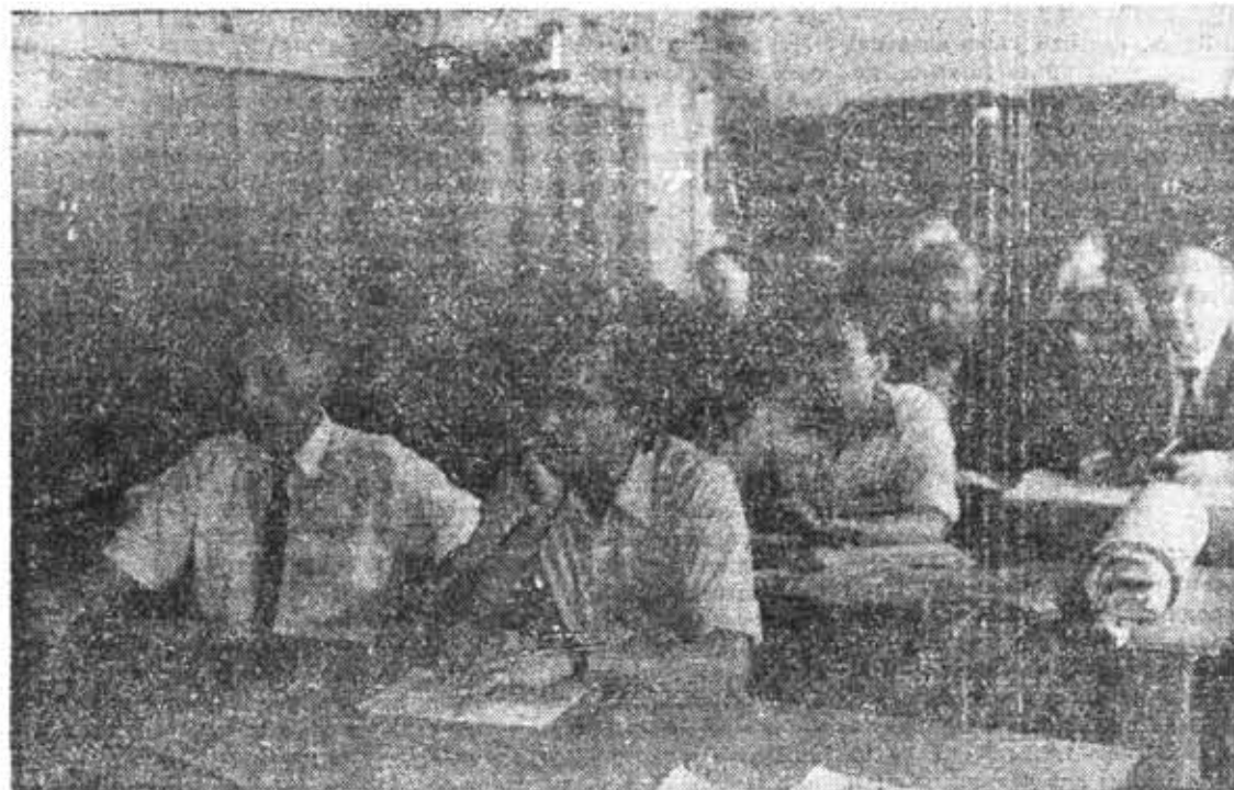
Участники конференции «Проблемы качества механических передач и редукторов. Точность и контроль зубчатых колес и передач». Фото З. Степановой

Отношения преподавателя со студентами должны строиться как совместная творческая деятельность; принцип педагогического общения — не со своими знаниями к студенту, а со сту-