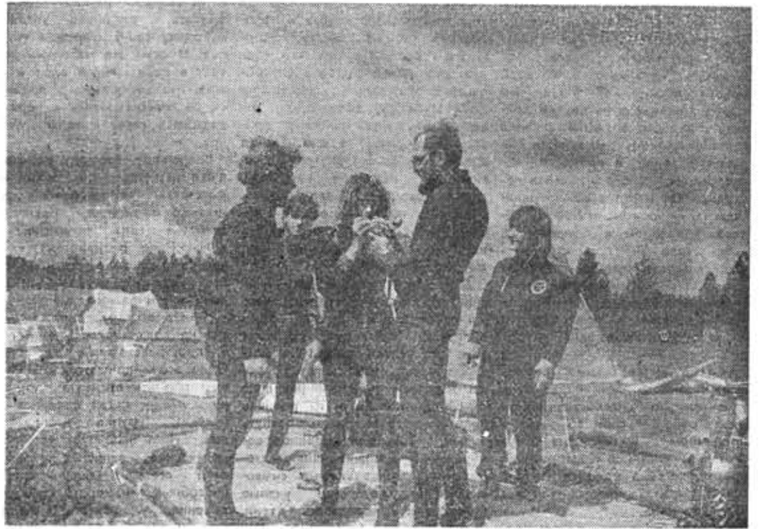
Подготовка к погружению.

Со временем ландшафт изменялся и часть древних поселений оказалась на дне озера Сенница; так что поиски приходится вести под водой. Для этого наши ре-