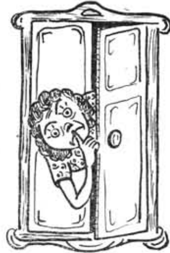
Так недолго до кошмара: Распахнул шкаф в момент, И на свет выходит Мара — Нелегальный элемент.