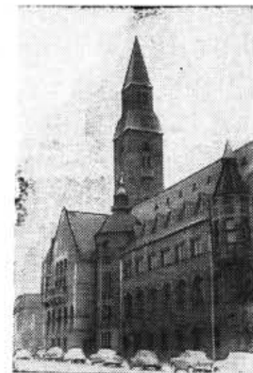
(Окончание. Начало см. в № 21)

В ФИНЛЯДИИ мы невольно обратили внимание на то, как заботятся там о детях. Ребятишки одеты очень опрятно и ярко. В детском саду, который мы посетили в г. Лахти, нам понравились чистота, удобство обстановки, рациональное использова-