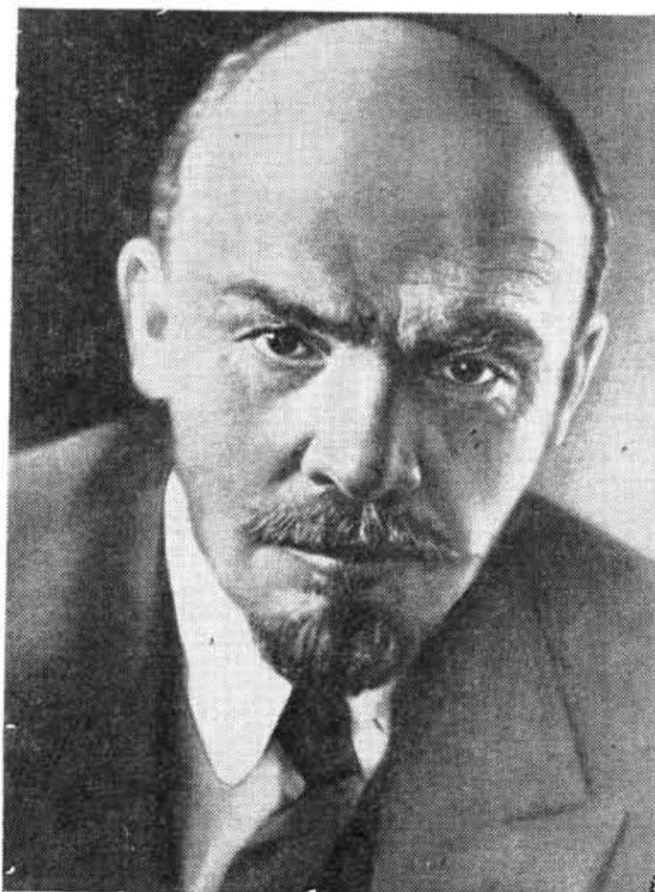
Ленин и теперь живет всех живых...

Все прогрессивное человечество с гордостью следит за успехами нашей страны, идущей по ленинскому пути вперед, к коммунизму! Простые люди всего мира вместе с нами отметили 22 апреля, торжественную дату — 90-летие со дня рождения вождя народов В. И. Ленина. А через несколько дней мы радостно встретим Первомай — праздник весны и счастья, которое дали нам Ленин и созданная им партия.