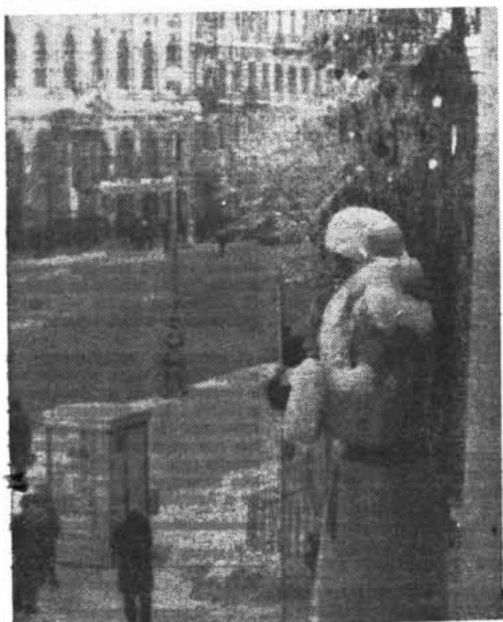
В предновогодний день на Невском проспекте.