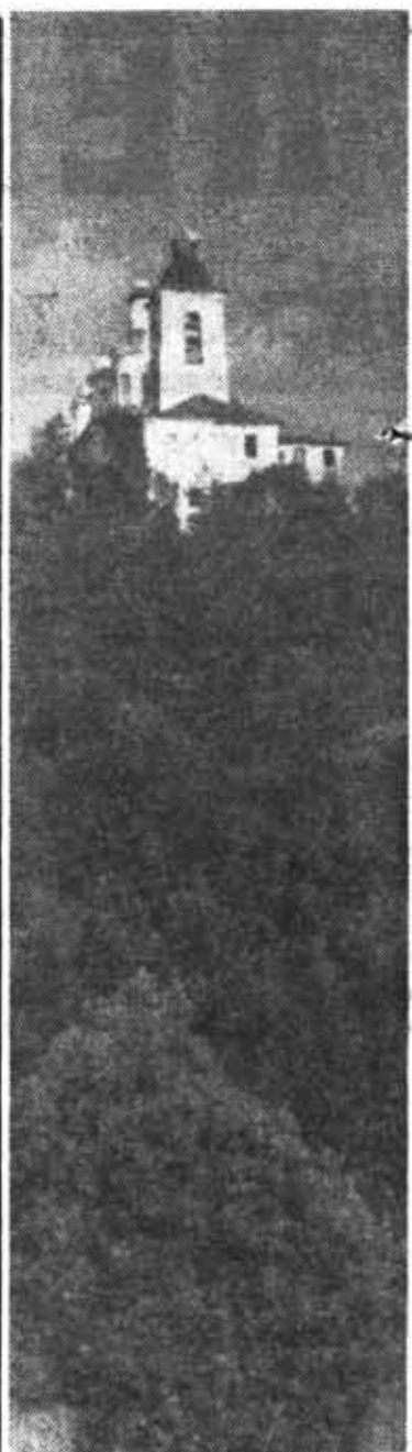
Маршруты студенческого лета. Соловецкий архипелаг. На острове Анзер.

В-шестых, охват системой политического образования преподавателей всех кафедр должен быть стопроцентным, исключая освобожденных. Уже сейчас, приступая к подготовке к новому учебному году, надо уточнить списочный состав кафедр. А уточняя списочный состав и сохраняя сложившийся состав семинаров и школ, необходимо сосредото-