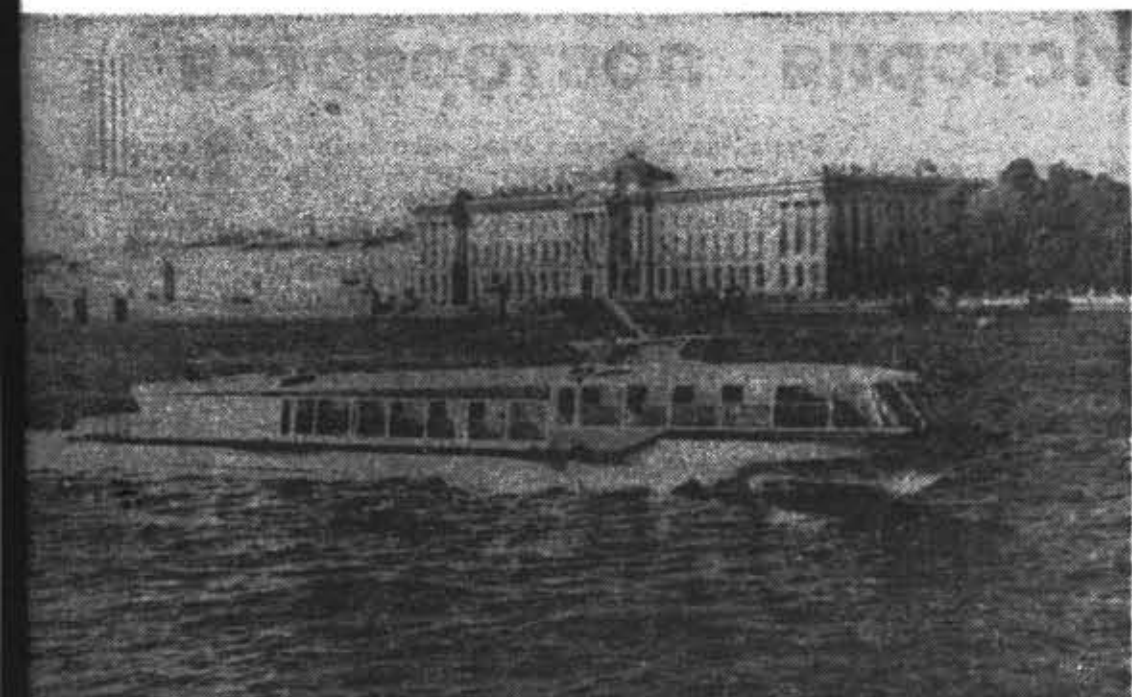
На внутригородской линии,

Совершенствуются транспортные перевозки. В летнее время на скоростной линии Ленинград — Кронштадт ежедневно 17 рейсов. Интенсивное движение судов на линии, связывающей центр города с ЦПКЮ. Трудящихся Невского района заинтересует пассажирская линия Ленинград — Невский лесопарк. Суда отправляются от речного вокзала (вместе Володарского моста).