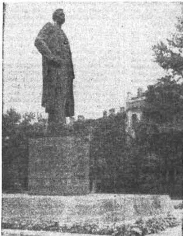
НА ПЕТРОГРАДСКОЙ СТОРОНЕ. У ПАМЯТНИКА МАКСИМУ ГОРЬКОМУ.

ЦЕНТРАЛЬНЫМ событием в спортивной жизни института была XXIII комплексная спартакиада ЛИТМО. Она проводилась по 14 видам спорта.