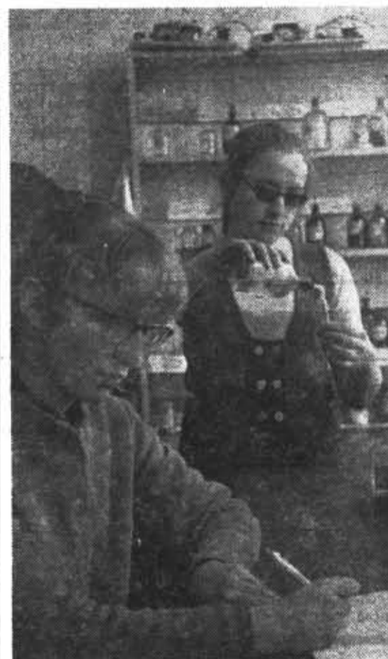
На занятиях по химии в 146-й группе.

Стипендия студентам назначается деканом факультета в пределах стипендиального фонда,