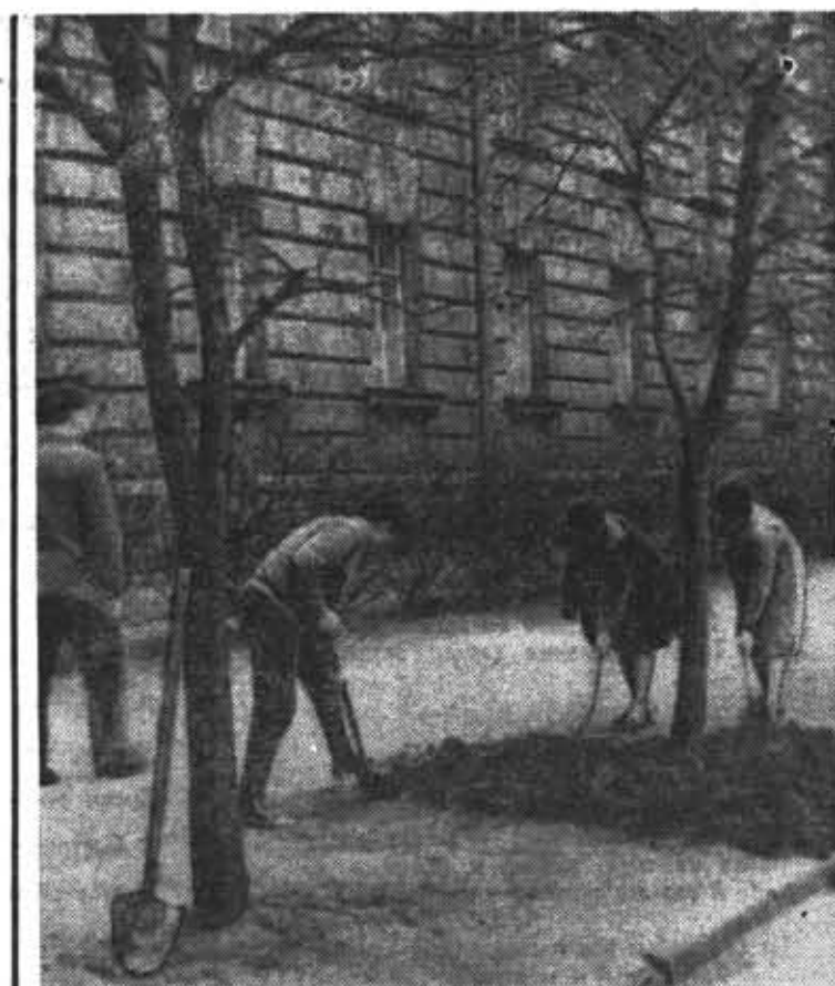
Весенние работы студентов обещают. Хочется, чтобы возле своего дома всегда зеленела свежая трава.

яющие настроения человека, ту неуловимую эмоциональную среду, в которой он живет. А как прозорлива ирония Ватто, которой наделены многие его персонажи. Одно из самых проникновенных произведений XVIII века — «Савояр» Ватто. Добродушный рыжий мальчик из Савойи с флейтой путешествует по стране в поисках заработка, вокруг — безлюдный пейзаж, и окна домов кажутся незрячими, а небо — такого холодного пронзительно-синего цвета, что вся небольшая с таким искусством написанная картина вызывает тревогу и беспокойство за человеческую судьбу. 250 лет назад работал Ватто, но он глубоко повлиял не только на художников своего века, что хорошо видно на выставке «Ватто и его время», которая только что открылась в Эрмитаже.